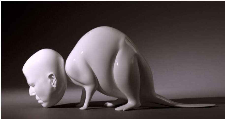
羅娜·龐迪克〈白海狸〉，2009-11，青銅、烤漆，版次：三之三 + 藝術家自藏版，33.02 x 80.01 x 23.49 cm。

〈枕頭頭〉和〈肚臍〉則暗示著誕生與依附，前者的微型頭部似乎正扭曲整個氣球狀的形體，卻又同時像從球體中浮現，形成一種隨時將爆裂的張力；後者〈肚臍〉從膨脹的形體中生長，更使人產生性的聯想，如同乳房與腹部。脆弱卻強烈的身體張力，撼動著觀者的感知。