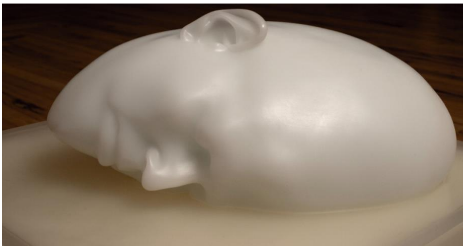
羅娜·龐迪克〈扭曲的白〉（細節），2019-23，著色樹脂、壓克力，單一版次，39.37 x 49.53 x 49.53 cm。

〈扭曲的白〉坐落於地面，同時感覺沉重又似乎漂浮著，巨型的頭部彷彿在休息、沈睡或從一潭白色的池水中浮現。龐迪克將頭型放大且扭曲，使其像一顆龐大的蛋，揭示著蛻變，隱含生與死、休息和成長、靜止和變化的一系列雙重含義。