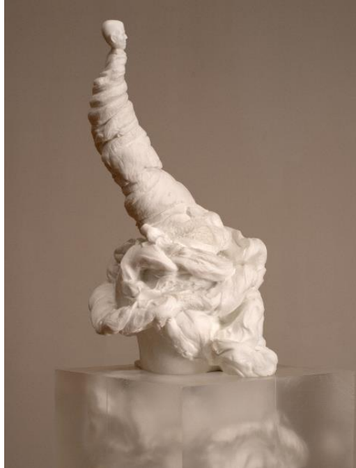
羅娜·龐迪克〈白色漩渦〉，2015-23，著色樹脂、壓克力，單一版次，86.36 x 20.79 x 24.92 cm。

〈扭曲的白〉坐落於地面，同時感覺沉重又似乎漂浮著，巨型的頭部彷彿在休息、沈睡或從一潭白色的池水中浮現。龐迪克將頭型放大且扭曲，使其像一顆龐大的蛋，揭示著蛻變，隱含生與死、休息和成長、靜止和變化的一系列雙重含義。