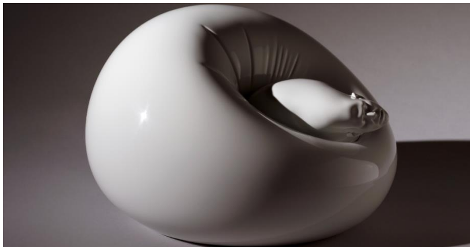
羅娜·龐迪克〈肚臍〉，2008-10，青銅、烤漆，版次：二之三 + 藝術家自藏版，18.25 x 28.57 x 28.57 cm。

兩件首次亮相的新作〈白色漩渦〉和〈扭曲的白〉以透明壓克力和著色樹脂製成，利用媒材半透明與不透光的對比，同時呈現清晰可辨與正在消融的形體。〈白色漩渦〉中，微型頭部向上竄升，好似身體被激烈地內外翻轉，下半部則浸沒在半透明壓克力方塊中，恍若在水中游泳亦或是溺水的狀態。鏡像的對照，如希臘神話的納西索斯（Narcissus）於水潭邊欣賞自己倒影的模樣，半明半滅的混亂，暗示著意識和潛意識的交錯相映。漩渦究竟意旨扭曲的腸子漸變成頭顱，亦或象徵劇烈情感的龍捲風？