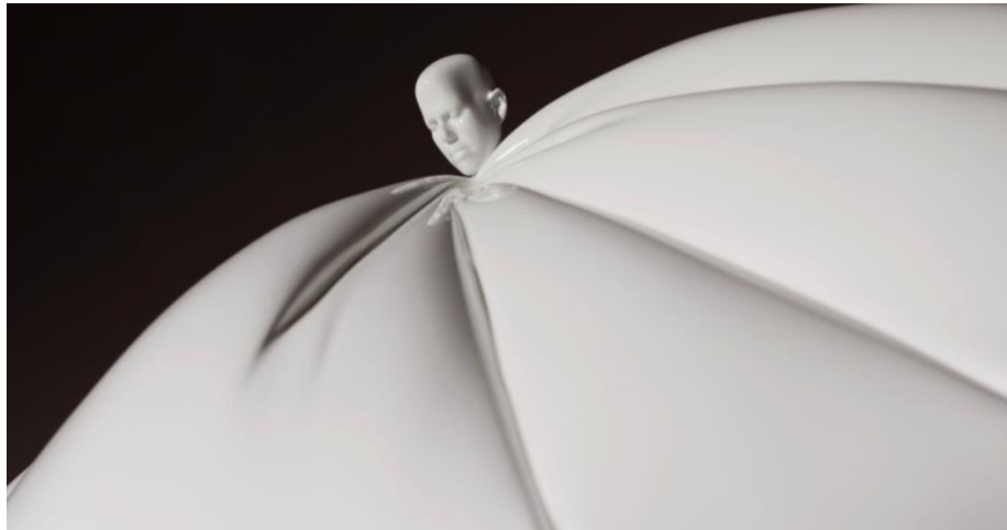
羅娜·龐迪克〈枕頭頭〉（細節），2009，青銅、烤漆，版次：二之三 + 藝術家自藏版，26.03 x 36.83 x 29.37 cm。