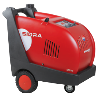
Quadro Elettrico 24 V 24 V Control Panel