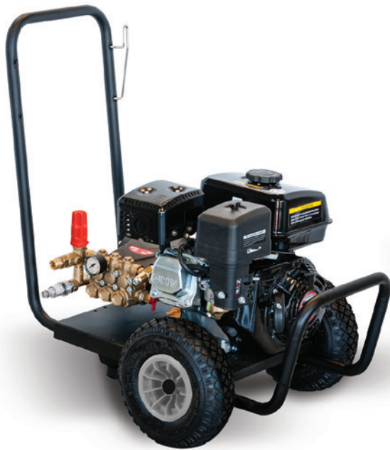
BENZINA GASOLINE (PETROL) 200/12 - 180/13