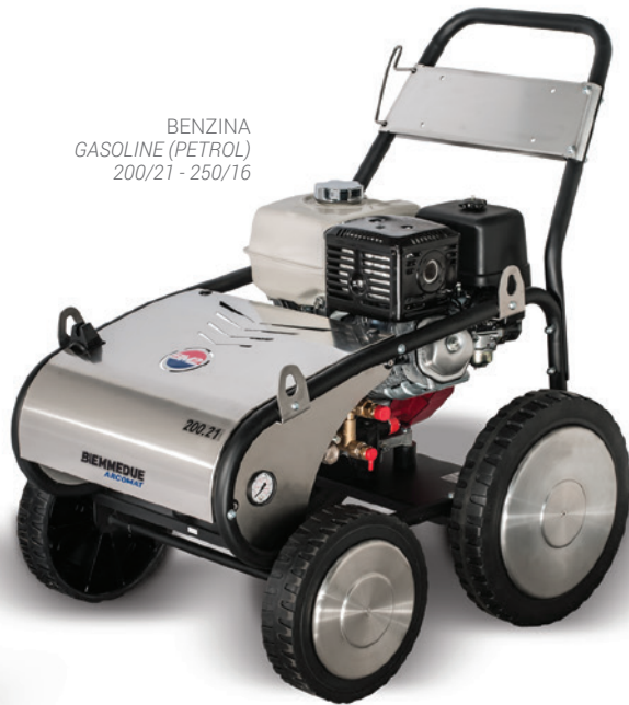
BENZINA GASOLINE (PETROL) 200/21 - 250/16