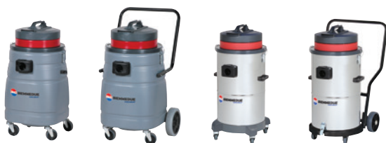
SM 50 B AC