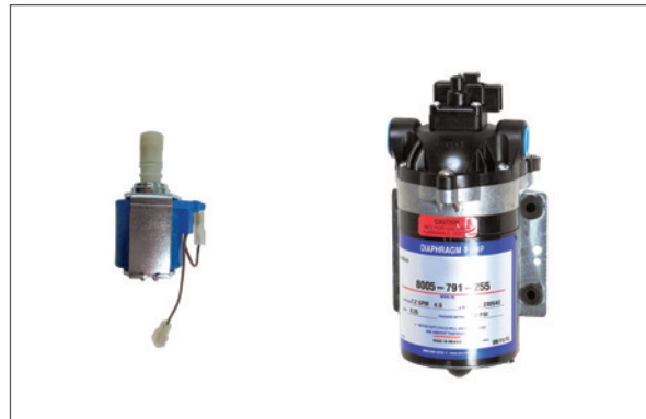
POMPA - PUMP EX 80 PRO