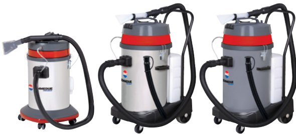
EX 40 EX 80 M ECO - EX 80 M PRO EX 80 P ECO - EX 80 P PRO