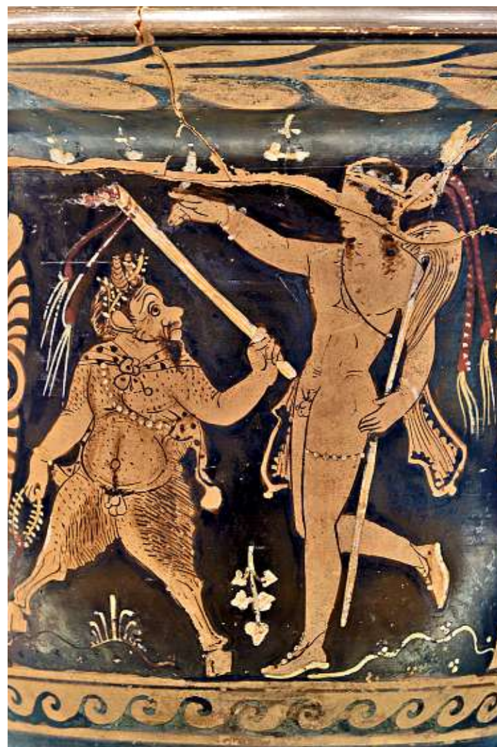
Las piezas que serán exhibidas a partir de enero vienen del Louvre.

Esta exposición es la primera de una serie de muestras que celebrarán los aniversarios del INAH.