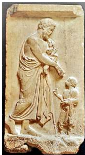
Estela funeraria, año 410 a.C.

Dioses, mitos y religión de la antigua Grecia tiene una selección de piezas de los siglos 7 al 4 antes de Cristo, y coincidirá también con los 50 años del Museo Nacional de Antropología, recinto que albergará la muestra en el primer trimestre del año, según anunció el presidente del Conaculta, Rafael