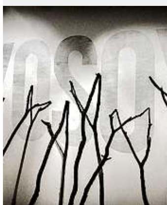
Sus obras utilizan recursos multimedia.