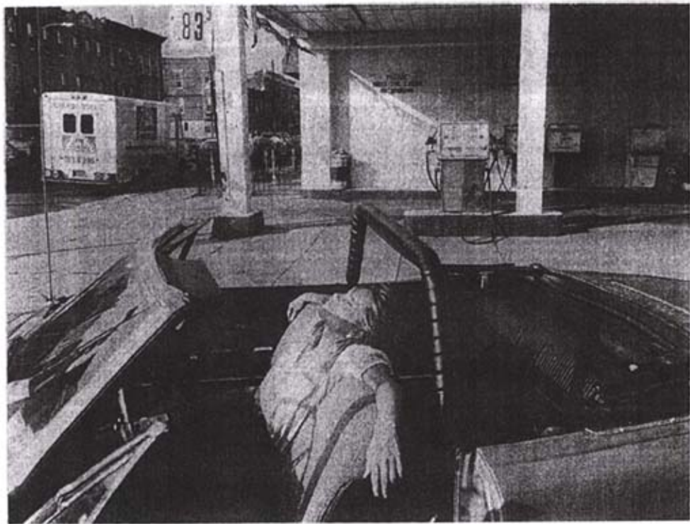
1ra - Found in Brooklyn, Brooklyn, NY.