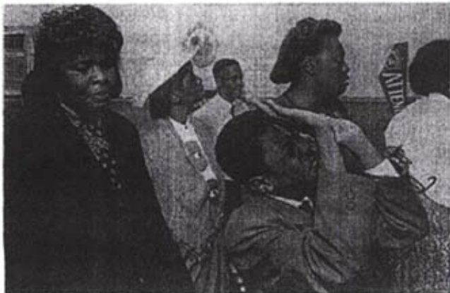
Fra «Come Sunday», Brooklyn, NY.

Fotografen Thomas Roma er Brooklyn-kronikøren fremfor noen. Han kombinerer visuell kompleksitet med menneskelig varme på en måte som har manglet i mye gatefotografi fra New York.