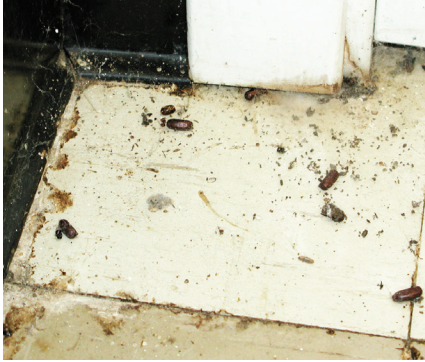
Es importante limpiar las cucarachas muertas, sus excrementos y huevecillos.

Los problemas con las plagas no terminan una vez que las plagas se han ido. Limpiar la suciedad que dejan ayuda a asegurar que se mantengan alejadas y es importante para proteger la salud. Las plagas muertas, así como sus excrementos y material de anidación pueden atraer a más plagas, transportar gérmenes y desencadenar alergias y asma.