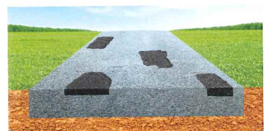
Bouchage de nids de poules.