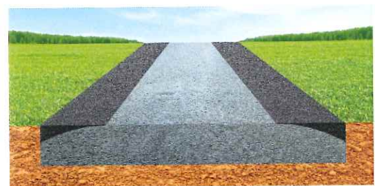
Reprofilage à la niveleuse ou au F.I.R..

Simplicité de mise en œuvre, résistance dans le temps, stockabilité ... L'enrobé dense à froid Compomac ® , disponible en vrac mais aussi en big bag et en seaux, est depuis de nombreuses années un produit de référence pour tous les petits travaux d'entretien de voiries courants ou localisés .