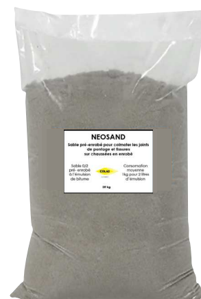
Sac de 25 kg

L'ensemble rend parfaitement la chaussée étanche.