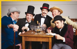
Besucher des Moulin Rouge