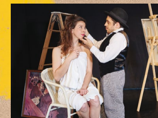
Der Maler und sein Modell