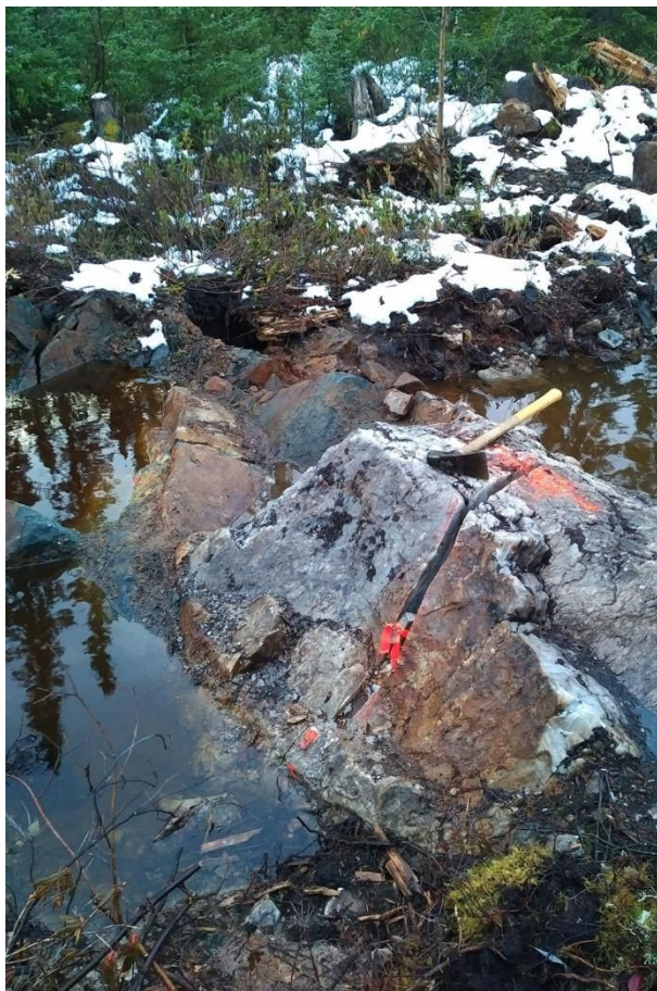
OR79 Zone – Quarzader in isoliertem Aufschluss