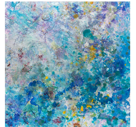
Shangri La Mallorca Mosaic (Mosaico) 1-6 , 2019, Acrílico sobre lienzo, 60 x 90 pulg; 30 x 30 pulg c/u (152.4 x 228.6 cm; 76.2 x 76.2 cm c/u).