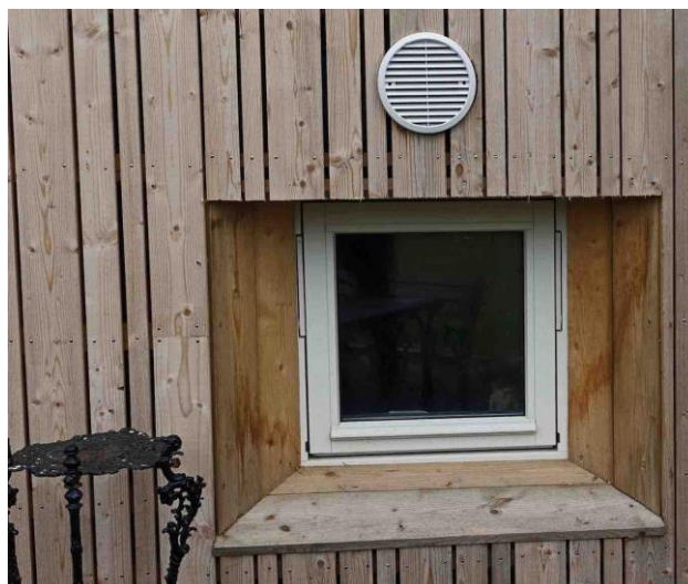
Ytterrist i panelt fasade