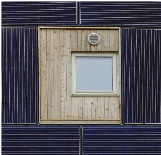
36 solcellemoduler på sydfasadene

3 par LUNOS e 2 . LUNOS e GO hybridventilator i tre bad.