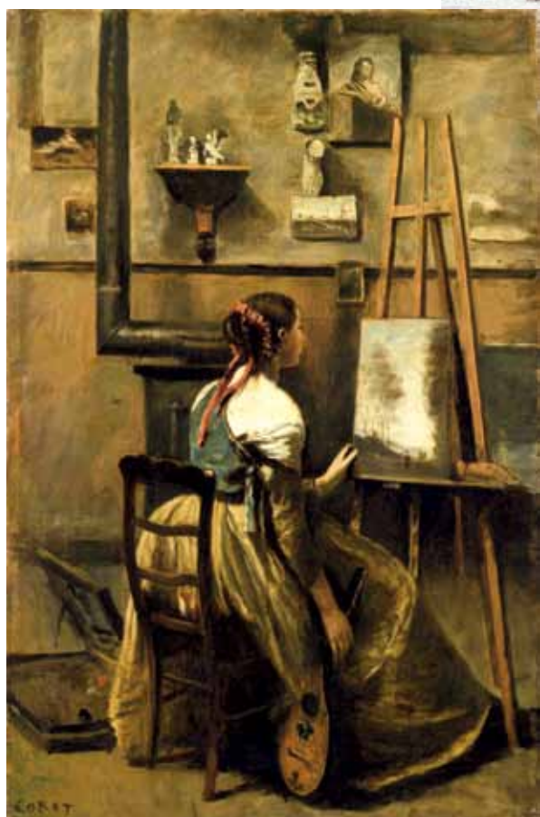
"L'Atelier de Corot. Jeune femme assise devant un chevalet" (vers 1873), de Jean-Baptiste Camille Corot.