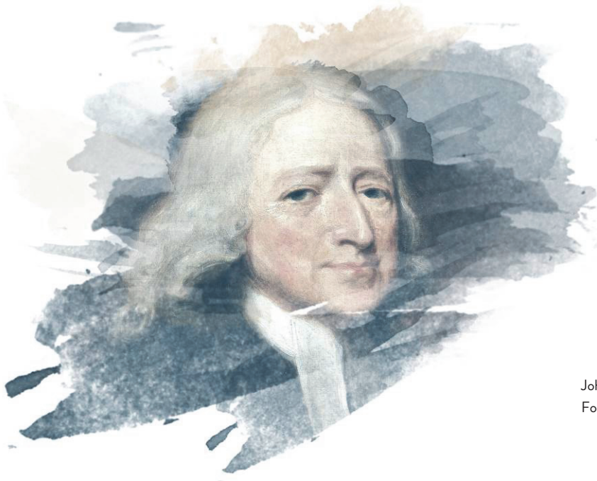
John Wesley, 1703-1791 Fondateur du méthodisme