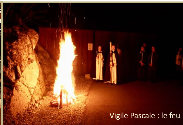
Vigile Pascale : le feu