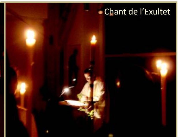
Chant de l'Exultet