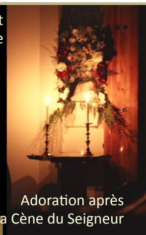
Adoration après la messe de la Cène du Seigneur