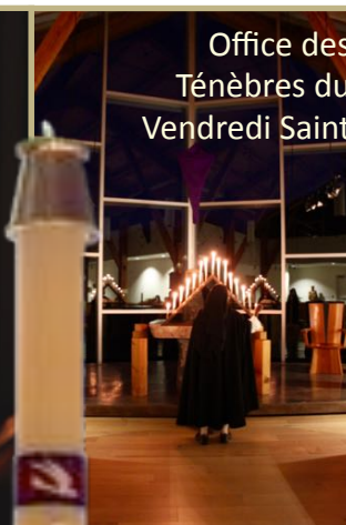
Office des Ténèbres du Vendredi Saint