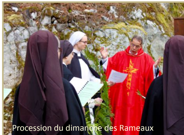
Procession du dimanche des Rameaux