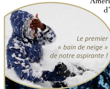
Le premier « bain de neige » de notre aspirante !