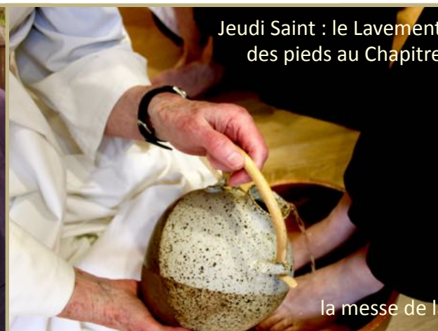
Jeudi Saint : le Lavement des pieds au Chapitre