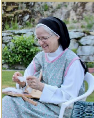
↳ Tissage et filage de la laine.