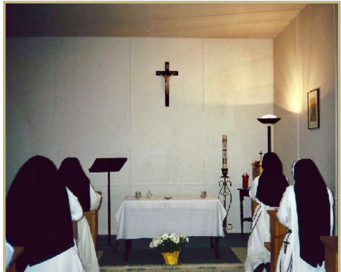
Prière dans notre première chapelle- un garage aménagé!

Au début des années 1990, Frère Timothy Radcliffe, alors Maître de l'Ordre, lançait un appel à volontaires pour fonder un monastère Dominicain dans l'ouest du Canada. Le monastère du Saint-Sacrement de Farmington Hills, Michigan, accepta de parrainer la nouvelle fondation. Le 27 novembre 1999, les cinq premières sœurs, provenant de différents monastères américains, célébraient pour la première fois les vêpres en terre canadienne – au centre diocésain de Rosemary Heights, diocèse de Vancouver. Deux ans plus tard, la communauté déménageait dans une nouvelle maison à Fort Langley. Le 17 octobre 2009, la fondation était reconnue de plein droit comme monastère de l'Ordre des Prêcheurs. La quête d'un terrain où bâtir un monastère permanent conduisit les Sœurs au nord de Vancouver, à Squamish. Nous avons demandé à nos fondatrices de vous parler un peu de cette aventure.