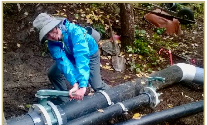
Travail sur le projet hydroélectrique.