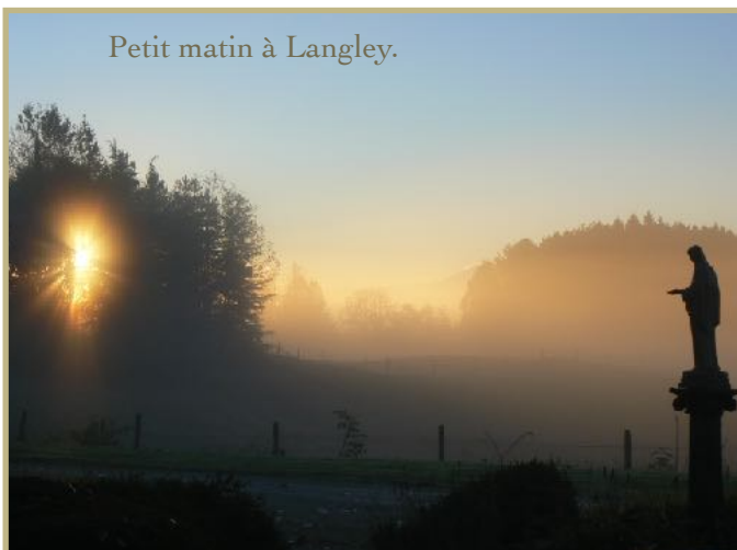
Petit matin à Langley.