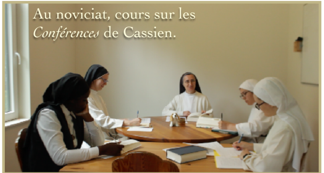
Au noviciat, cours sur les Conférences de Cassien.