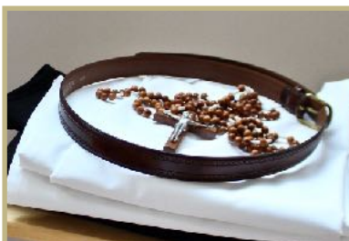
Prise d'habit de Sr. Maris Stella de la Trinité Le 21 septembre