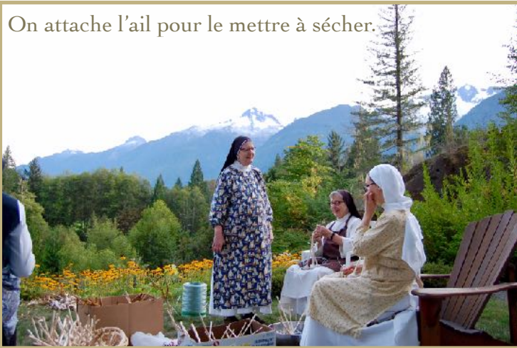
On attache l'ail pour le mettre à sécher.