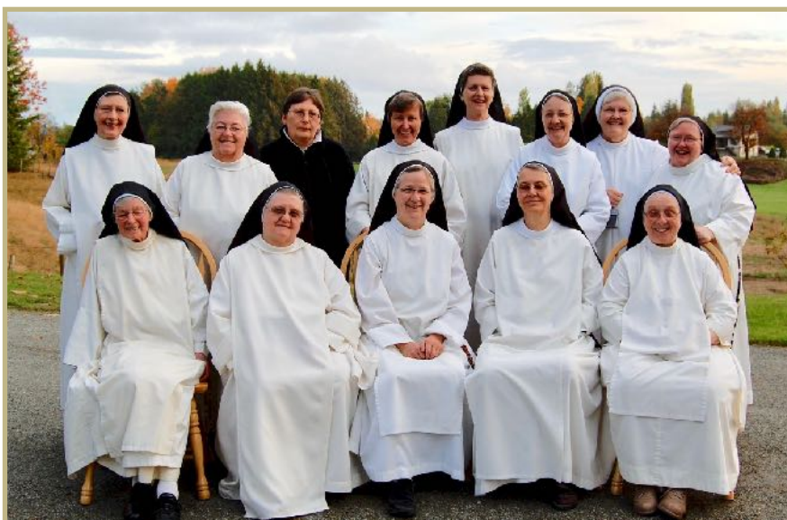
Célébration de notre érection canonique en 2009.

Qu'est ce qui fait le coeur de votre vie communautaire?