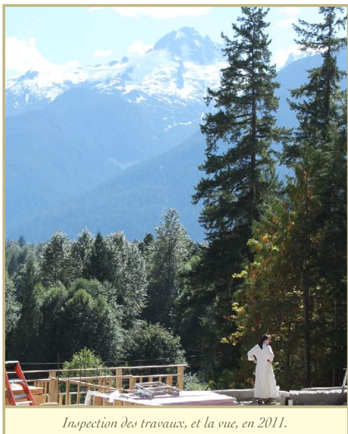
Inspection des travaux, et la vue, en 2011.

NB : L'Ordre des Prêcheurs, auquel nous appartenons, a fêté récemment ses 800 ans. Ce n'est qu'un début!