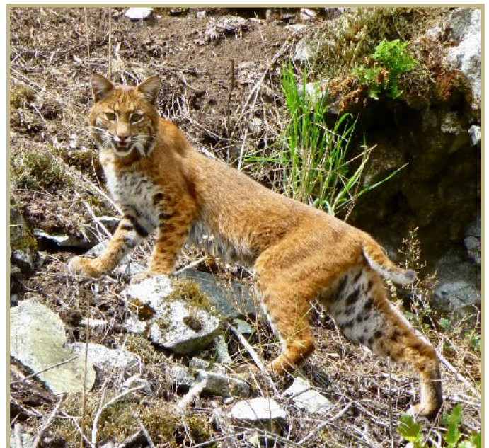
Un lynx a visité notre cloître en août dernier.

Vos Soeurs du monastère Reine de la Paix.