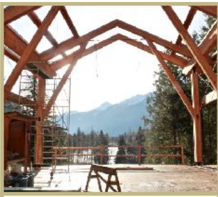
Verrière de la chapelle, 2011