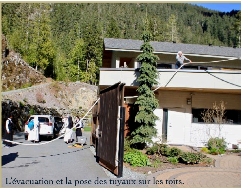
L'évacuation et la pose des tuyaux sur les toits.