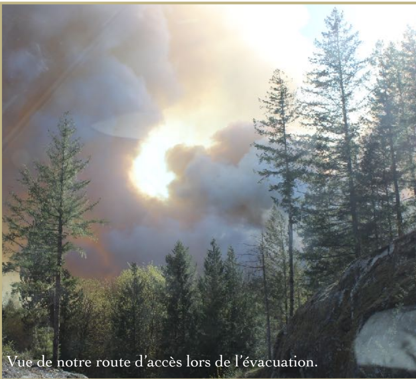
Vue de notre route d'accès lors de l'évacuation.