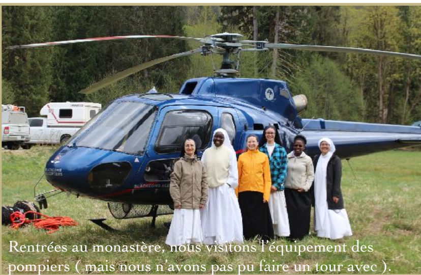
Rentrées au monastère, nous visitons l'équipement des pompiers ( mais nous n'avons pas pu faire un tour avec ).