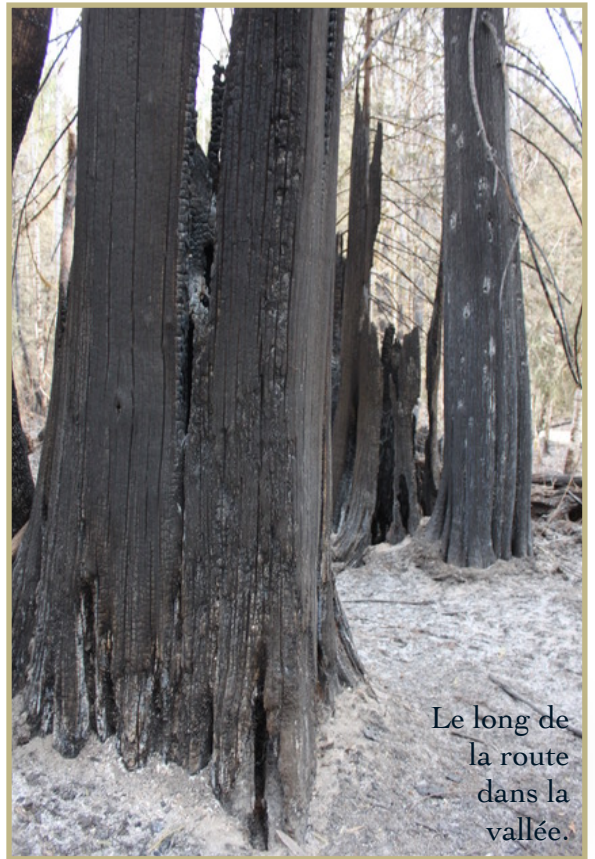
Le long de la route dans la vallée.