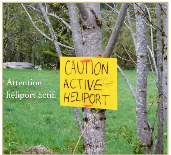
Attention héliport actif.