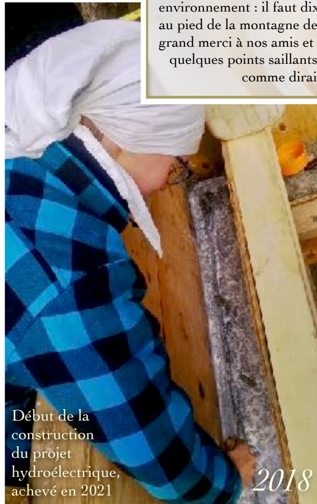
Début de la construction du projet hydroélectrique, achevé en 2021