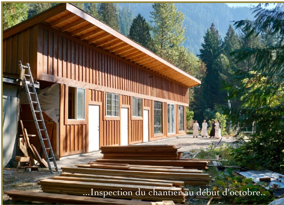
...Inspection du chantier au début d'octobre..