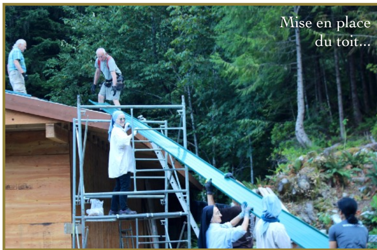
Mise en place du toit...