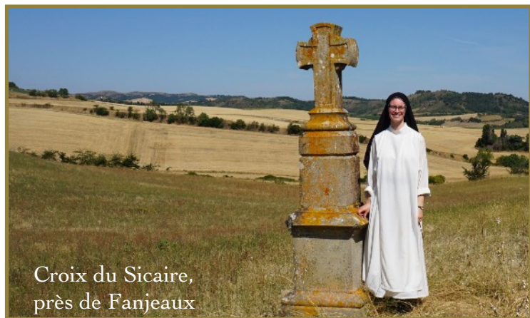
Croix du Sicaire, près de Fanjeaux

Le monastère de Prouilhe est le berceau historique de l'Ordre Dominicain. Le monastère actuel se trouve à quelques pas des sites où saint Dominique a vécu et prêché. Guidée par le frère François-Dominique Forquin OP, j'ai passé trois jours avec d'autres pèlerins à marcher sur les chemins de Fanjeaux, Montréal et Laurac. Le paysage a changé au cours des 800 dernières années, mais la géologie des montagnes du Tarn et des Pyrénées reste la même. Ce paysage rendait réelle une histoire que j'avais apprise dans mes cours de formation, mais que j'avais un peu de mal à faire mienne sur la côte ouest du Canada. Ce que je savais avec ma tête, je l'apprenais maintenant avec mes pieds, ce qui me rendait saint Dominique bien plus vivant et présent !