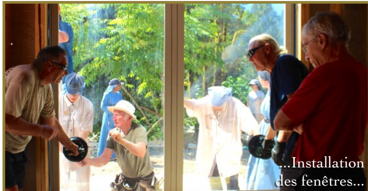
...Installation des fenêtres...