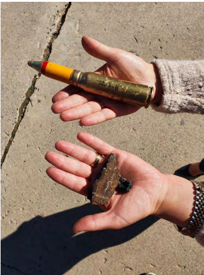
مامۆستایەک، پارچەبەکی بۆردوومان و گولەبەکی نەتەقیو کہ پاشماوہی ھێرشەکانی تورکیان بۆسەر گوندی ھەروزی نیشاندەدات. تشرینی دووہمی ۲۰۲۱.

لەپال کوشتن و بریندارکردنی ھاوڵاتیانی مەدەنی باکوری عێراق، بۆردوومانەکانی سوپای تورکیا و داگیرکاری ناوچەکانی سەر سنور بوونەتە ھۆی زیانی ماددی، وێرانبوونی خانووی، لەناوچوونی کاسپی و تیکچوون و وێرانبوونی ئەو کیلگانەکی کہ بۆ کشتوکال و لەوہراندنی ئاژەل بەکاردەھیندری. ئەم ھێرش و ئۆپەراسیۆنانە، بوونەتە ھۆی چۆلبوونی لانی کەم ۵۰۰ گوند و کۆچکردنی گوندنشینان بەرەو شارەکان و دروستبوونی قەیرانی مرویی.