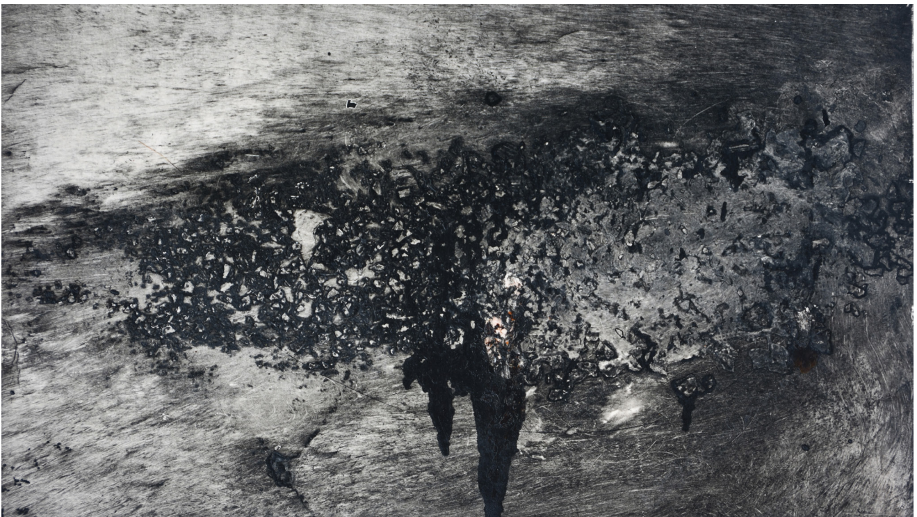
Sans titre. Gravure au carborundum, 23,5 x 37 cm.

Le 24Beaubourg présente pour la seconde fois une exposition personnelle d'Ece Clarke. Nous retrouvons l'univers de cet artiste qui emploie différentes techniques plastiques et artistiques, de l'estampe à la peinture. Au cœur de la démarche de l'artiste, le passage de l'espace-plan à la tridimensionnalité. La gravure d'une matrice est la première étape du processus. Sortie de presse, la feuille gravée reçoit la peinture, les pigments naturels, les résines, la gomme-laque et Ece Clarke laisse la réaction chimique s'opérer entre ces différents liquides qui créent des fractales, des meurtrissures ou des béances si l'artiste approche une flamme du papier. Cette feuille gravée est ensuite parfois transformée en objet-cylindre, action qui peut être vue par exemple comme la dernière étape du processus créateur. Le cylindre est maintenu dans cette forme par les puissants aimants qu'utilise Ece Clarke. L'essence même de l'objet-substantiel, selon l'expression de l'artiste, se trouve dans ce cylindre qui symbolise alors le début et la fin de toute chose, le vide et le plein. Ece Clarke nous invite à un voyage intérieur.