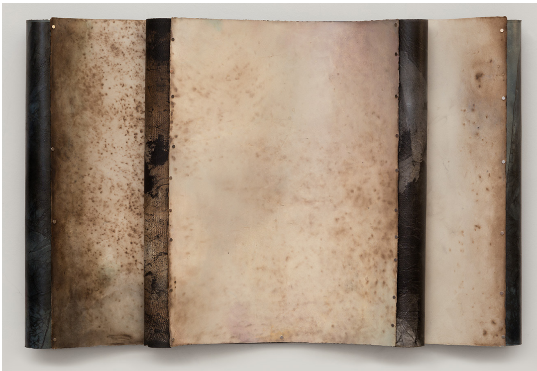
Sans titre. Technique mixte sur papier et aimants, 76 x 112 cm