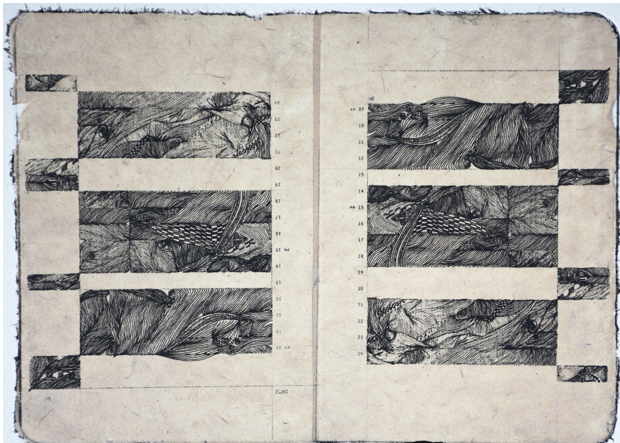
Sans titre. Gravure sur papier cire, 28 x 37 cm.