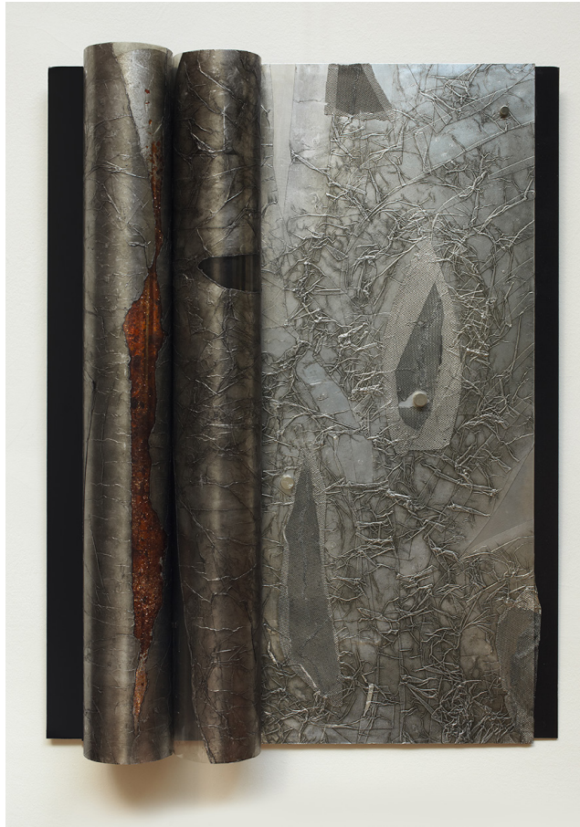
Sans titre. Aluminium et acétate, 76 x 56 cm.