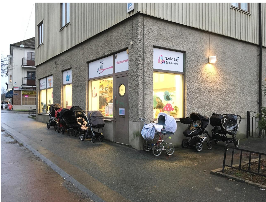
Figur 3. Leksaksbibliotekets fasad.

Ett exempel är att Leksaksbiblioteket kan bidra till levande gatuplan. Levande gatuplan innebär lokaler i bottenplan på flervåningshus karakteriserade av verksamheter, återkommande dörrar och fönster samt ett tydligt samspel med det omkringliggande stadsrummet. Konceptet står högt upp på agendan i dagens stadsutveckling, i Sverige liksom internationellt (Heffernan et al. 2014, Linn 2018). Begreppet implicerar också en önskan om att gatuplanen ska innehålla synliga mänskliga aktiviteter. Detta i kontrast till det som ibland kallas för ”inaktiva” eller ”döda” gatuplan. Med andra ord ses oftast levande gatuplan, åtminstone implicit, vara ett positivt och värdeskapande inslag i stadsrummet. Leksaksbiblioteket i Majorna ligger på första våningen och har stora fönsterytor mot Slottsskogsgatan, som gör att förbipasserande enkelt ser aktiviteten innanför (se Figur 3).