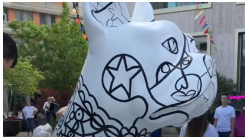
Renaissance Hotels (Bild anklicken)