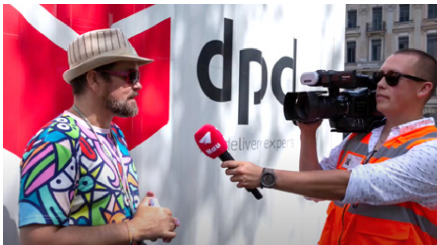
dpd und KMSK (Bild anklicken)