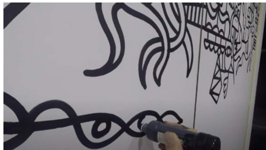
Raiffeisen (Bild anklicken)