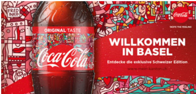
Branding / Werbung