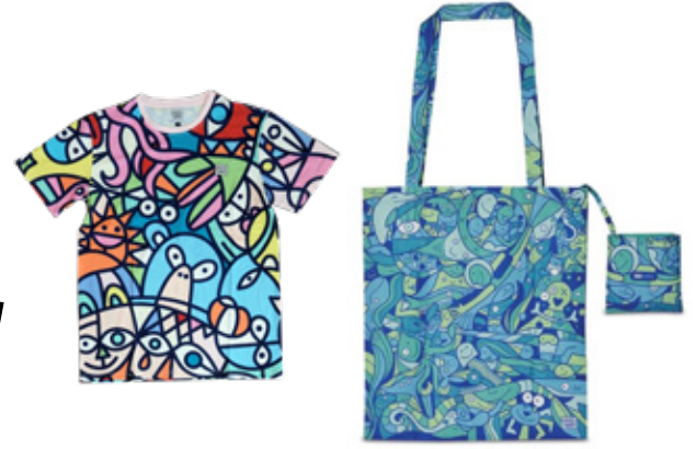
Give aways / Merch