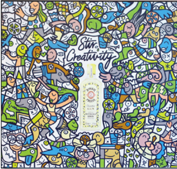
Finales Bild / Raumgestaltung