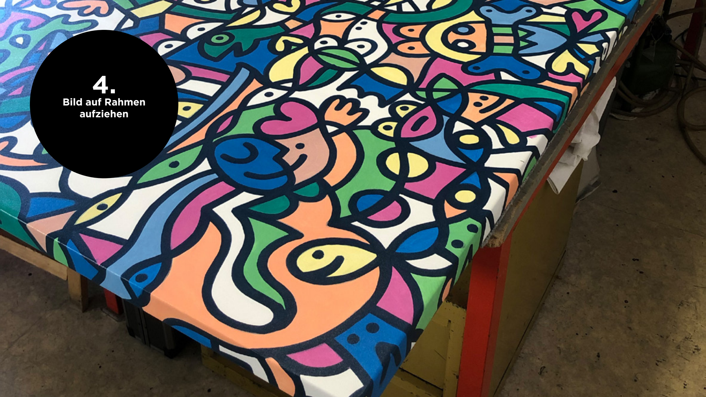
Bild auf Rahmen aufziehen