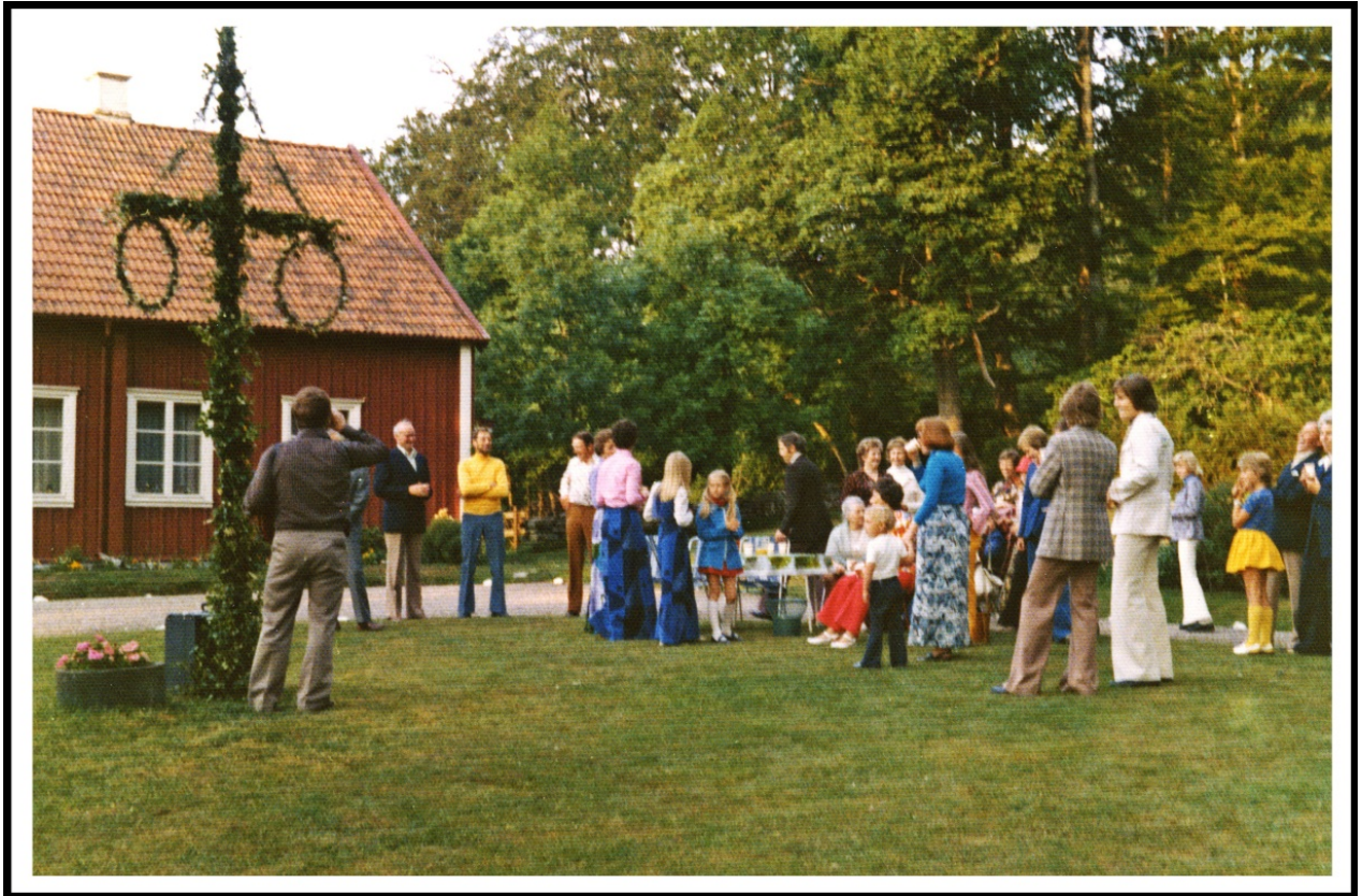
Midsommarafton med fest och dans i magasinets andra våning.