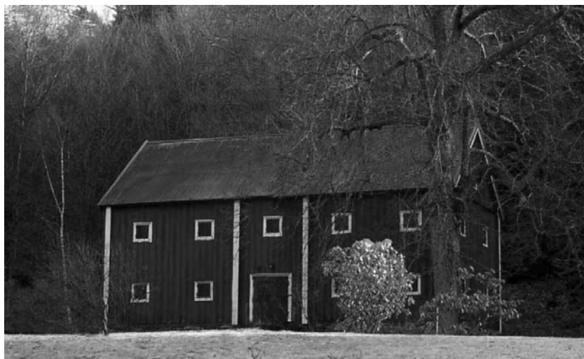
Spannmålmagasinet intill berget vid gårdsplanen byggs.