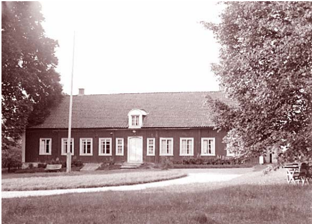
Alfhems Kungsgård 1931