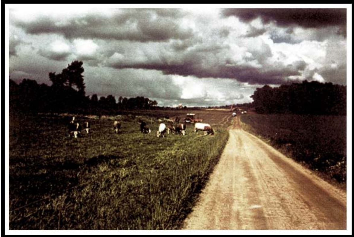
Alfhems Kungsgårds sista kor.