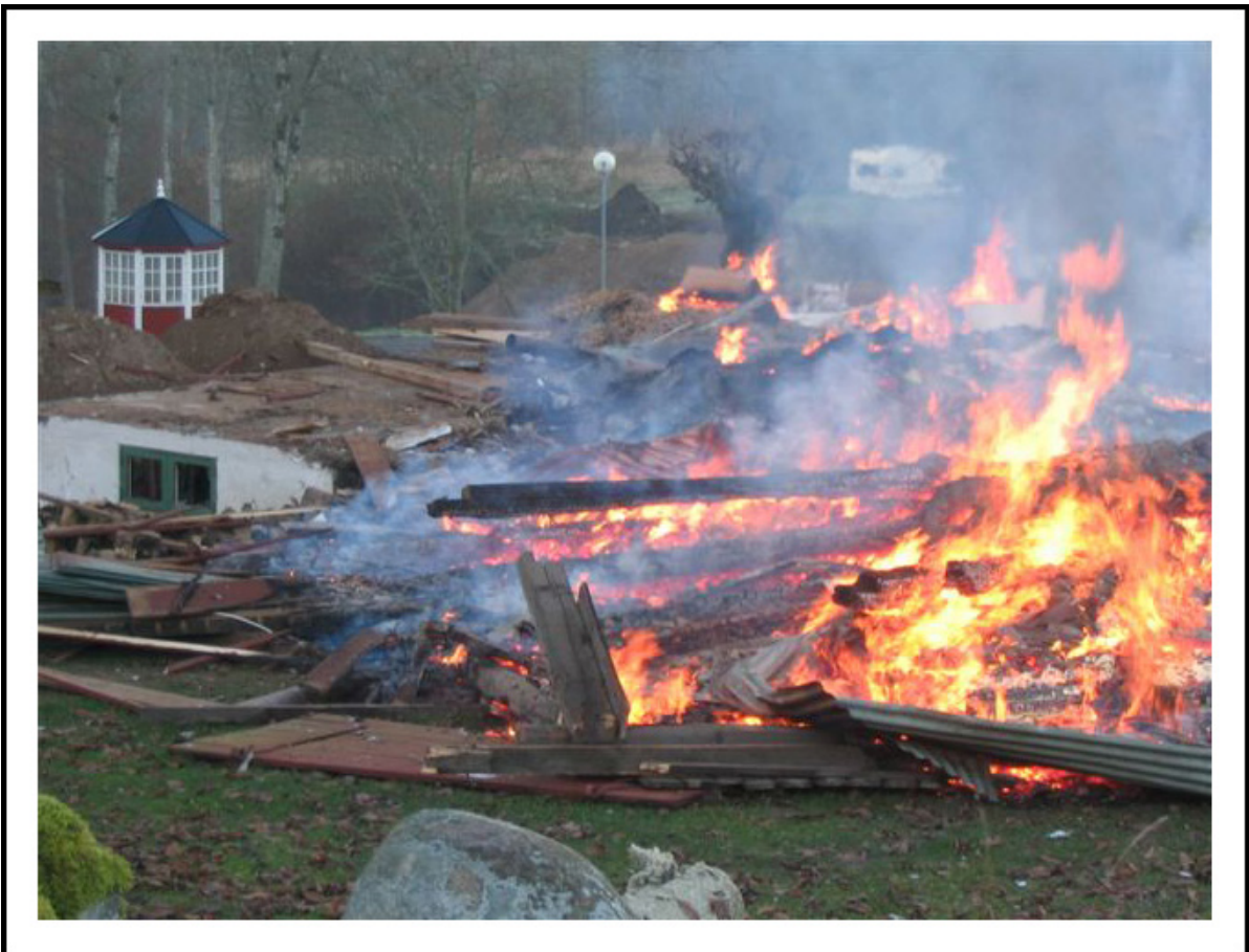
Gamla verkstaden och garaget rivs och eldas upp 2004.