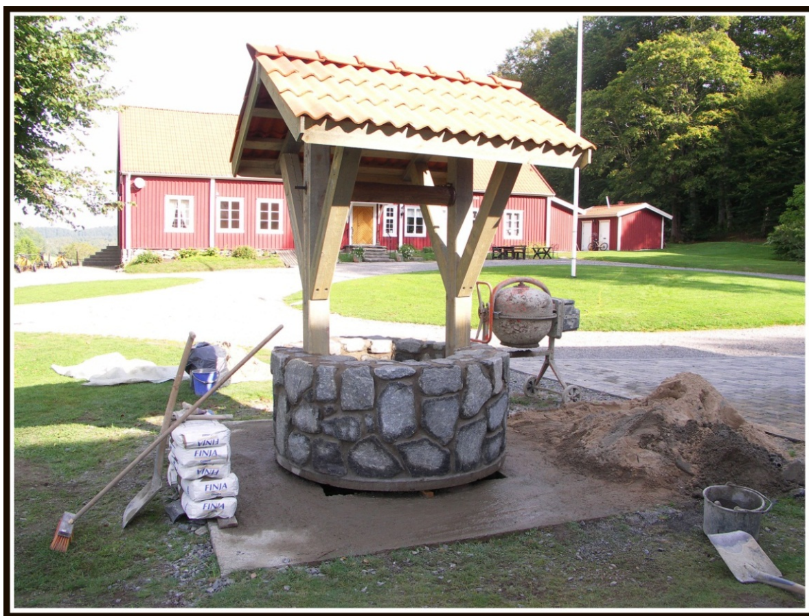
Gamla brunnen på gårdsplanen tas fram och förses med överbyggnad.