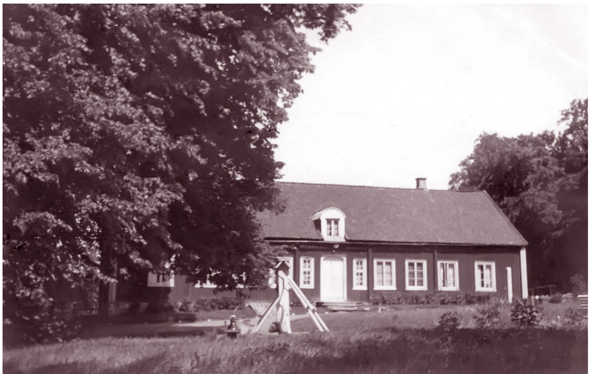
Alfhems Kungsgård 1940