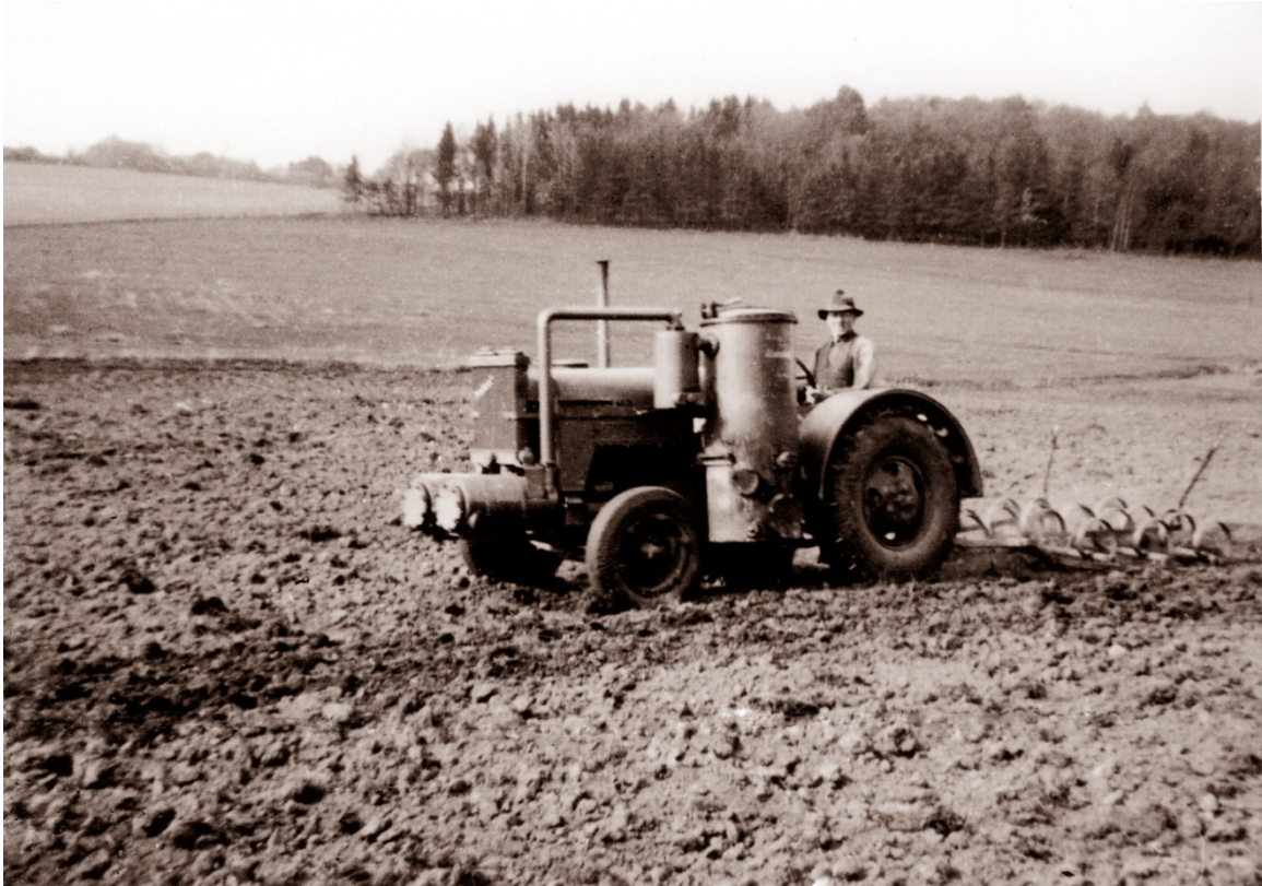
Bertil Frössling med sin gengasdrivna traktor harvar 1940. Här på nuvarande driving-rangen med ekekullen i bakgrunden.