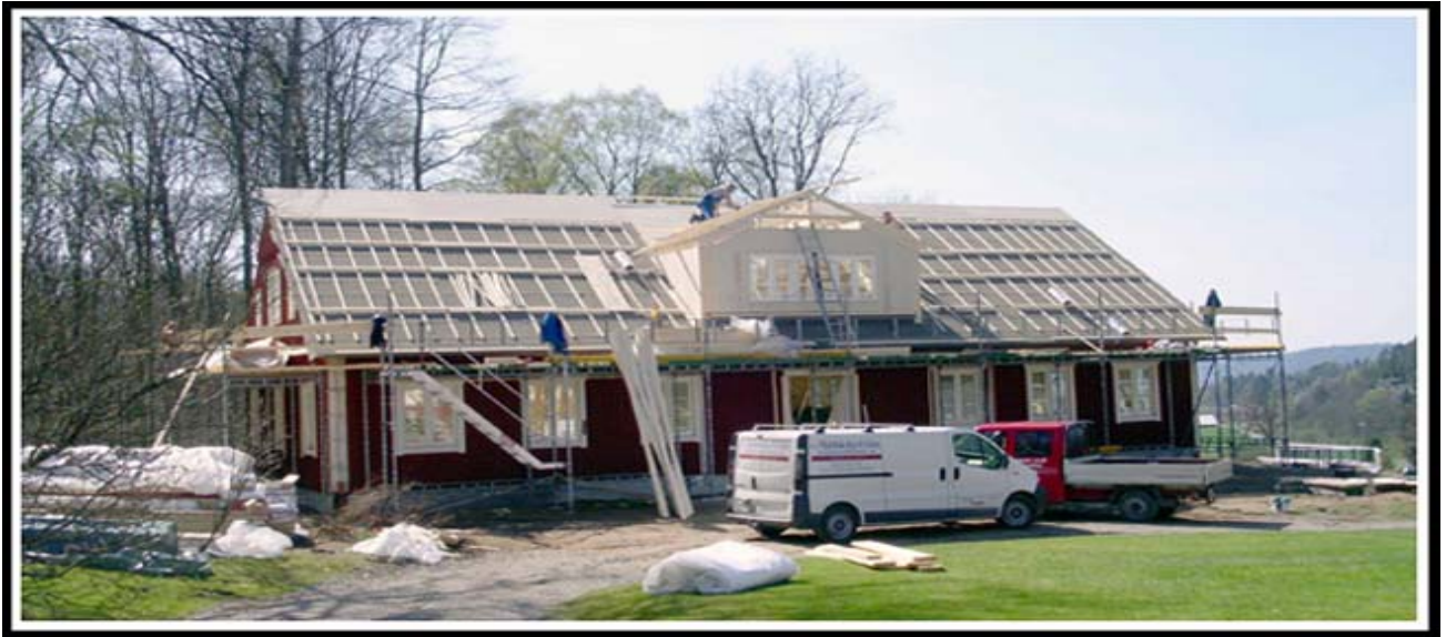
Ale GK bygger nytt klubbhus februari 2004 - april 2005. Kostnad c:a 4 mkr.