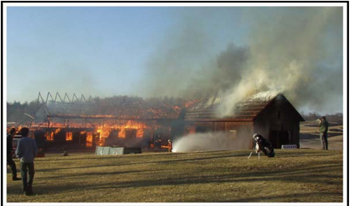
Ladan, byggd 1917, bränns ner för att göra plats för den nya golfparkeringen. Ale Räddningstjänst bränner ner byggnaden som övningsobjekt.