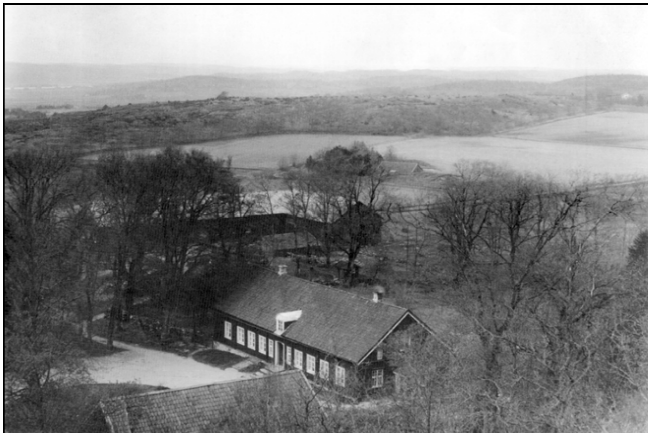
Alfhems Kungsgård 1921

(Kungsgård: Större gård i svenska kronans ägo.)