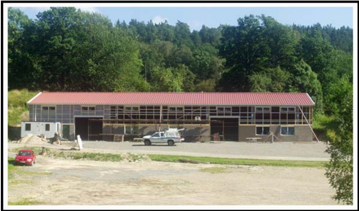
Ny maskinhall uppförs. Kostnad 2,2 mkr.