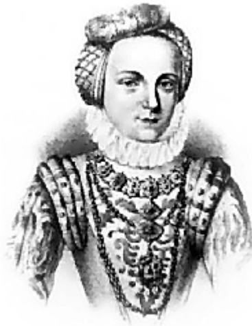
Katarina Stenbock 1535-1621 Gift med Gustav Wasa den 22 augusti 1552

Alfhem förlänades till Gustav Olofsson Stenbock , vars dotter Katarina blev Gustav Vasas tredje hustru.