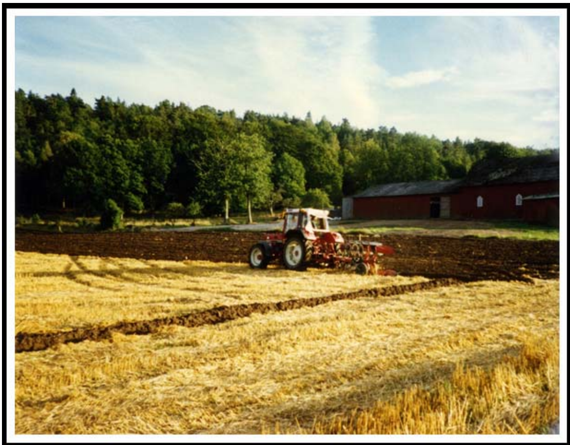
Sista plöjningen 1990.