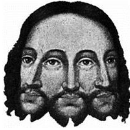
Ilustrasi dari Trinitas Ortodoks Satu Allah yang terdiri dari tiga pribadi (hipostasis) bersatu di dalam satu makhluk

Trinitas ortodoks adalah ajaran resmi Katolik dimana satu Allah Alkitab adalah satu makhluk yang terdiri dari tiga hipostasis yang sadar diri. Sebagai catatan, hipostasis adalah kata Gerika yang digunakan oleh para penganut Trinitas Ortodoks untuk menggambarkan jenis hidup yang sebenarnya unik bagi Trinitas, yang terletak di antara sifat dan makhluk, dan tidak dapat diartikan lebih dari sifat ataupun makhluk. Konsep tentang Allah ini, walau kedengaran membingungkan, adalah pandangan lazim yang diterima oleh umat-umat Kristen.