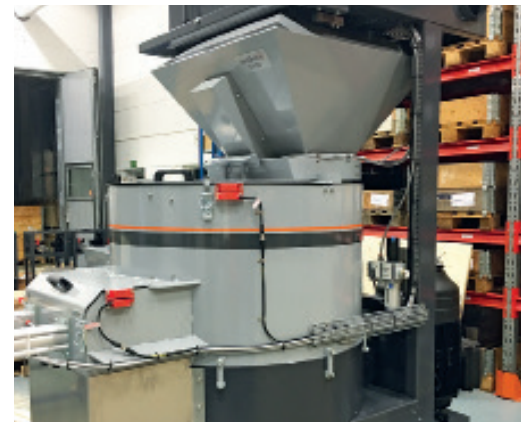
Die Chargengröße kann dank der eingebauten Waage entsprechend angepasst werden.