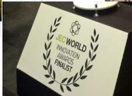
NOKIA OYJ 20.5.4.30