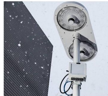
Tukiasemat. 5g-verkot rakentuisivat valaisinpylväiden varaan.