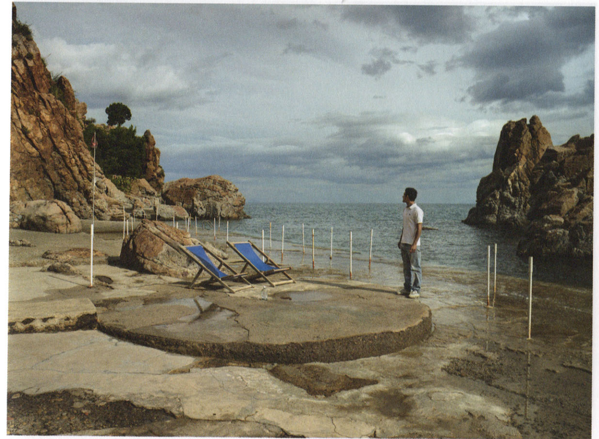
Carl De Keyzer, Cefalù, Italië, uit het boek Moments before the Flood (Lannoo, 2012). Zie het artikel op p. 108 e.v.

"IN HET MUSEUM VAN CHICAGO" VAN HUGO CLAUS