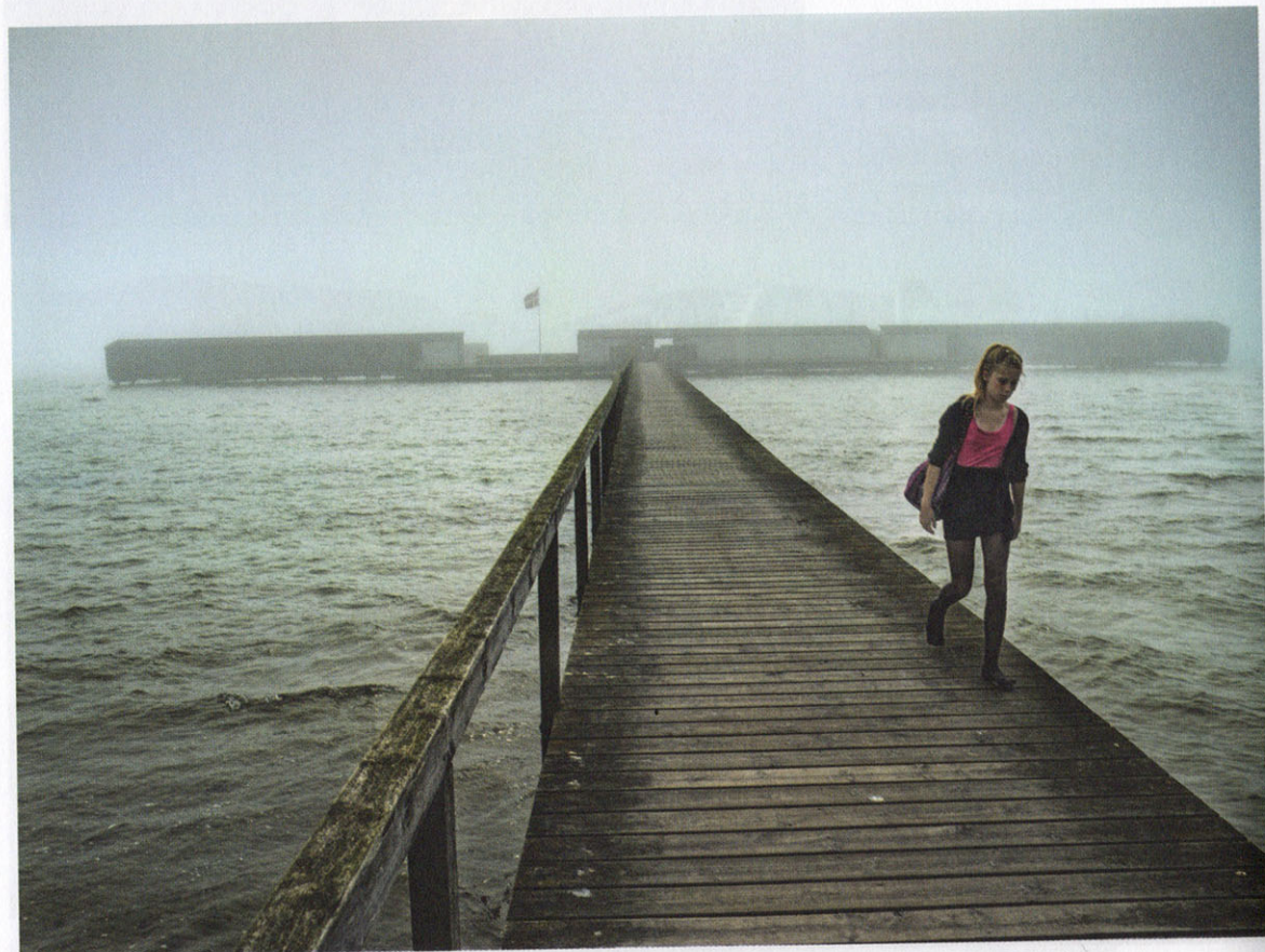
Carl De Keyzer, Dragør, Denemarken, uit het boek Moments before the Flood (Lannoo, 2012). Zie het artikel op p. 108 e.v.