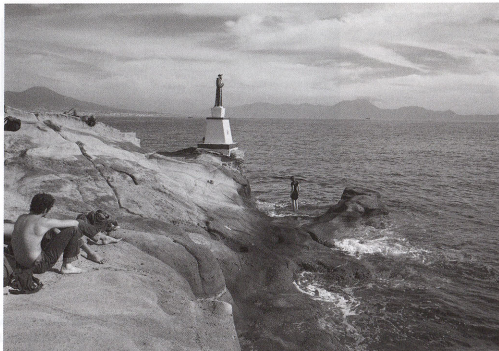
Napels, Italië, Foto Carl De Keyzer.

hij met heel wat collega-fotografen te delen. Opvallend: in het Griekse Elefsina fotografeerde De Keyzer hetzelfde gekapseisde passagiersschip als Nikos Markou in Sense of Place . Midden in de Europese financiële crisis kon ik moeilijk anders dan in het schip van Markou en De Keyzer een symbool te zien van het al te lang afwachende, door bureaucratie en verdeeldheid verlamde continent. "Is Europa alleen maar een 'ruimte'", vraagt Herman Van Rompuy zich af in het voorwoord van Sense of Place , "of kan het ook een plaats worden?" De voorzitter van de Europese Raad doelt op een plek waar je je thuis voelt, net zoals je je na een verre reis meteen thuis kunt voelen komen in een huis, een straat, een dorp of stad, een gemeenschap of een land. Bepaald geen dwaze vraag. Van een Europees thuisgevoel bij Griek, Brit, Spanjaard en Pool, van de wil tot solidariteit en gemeenschapszin, daarvan hangt de toekomst van het Europese project stilaan af. Europa als een unie van vijfhonderd miljoen thuisgevoeltjes? Daar zijn we nog lang niet.