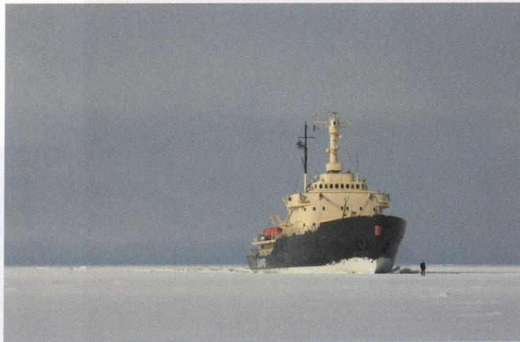
Guido van der Werve, Nummer acht - Everything is going to be alright , 10'10", 16 mm film op HD, Botnische Golf, Finland, 2007 © Gallery Juliette Jongma, Amsterdam / Guido van der Werve. Zie het artikel op p. 80 e.v.