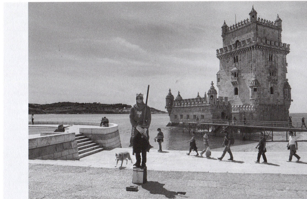
Lissabon, Portugal, Foto Carl De Keyzer.

Carl De Keyzer heeft een genadeloos oog voor compositie, symmetrie, detail en voorval. Hij is zo geduldig en trefzeker dat achter de lens zich gewillig een dekeyzeriaanse wereld naar zijn fotografenhand schikt. In het Ierse Ballaghaline tovert De Keyzer zomaar een regenboog uit het hoofd van een verwaalde vrouw. In Lissabon laat hij een als kruisvaarder verklede straatartiest balanceren op een doosje