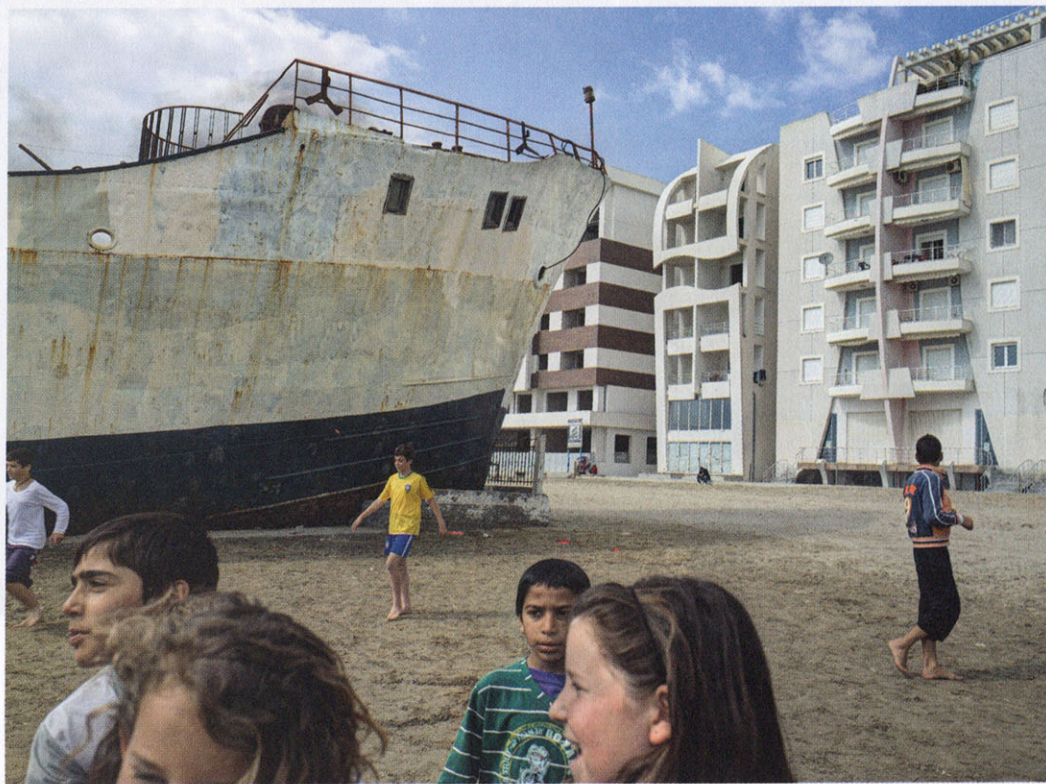
Carl De Keyzer, Durrës, Albanië, uit het boek Moments before the Flood (Lannoo, 2012). Zie het artikel op p. 108 e.v.