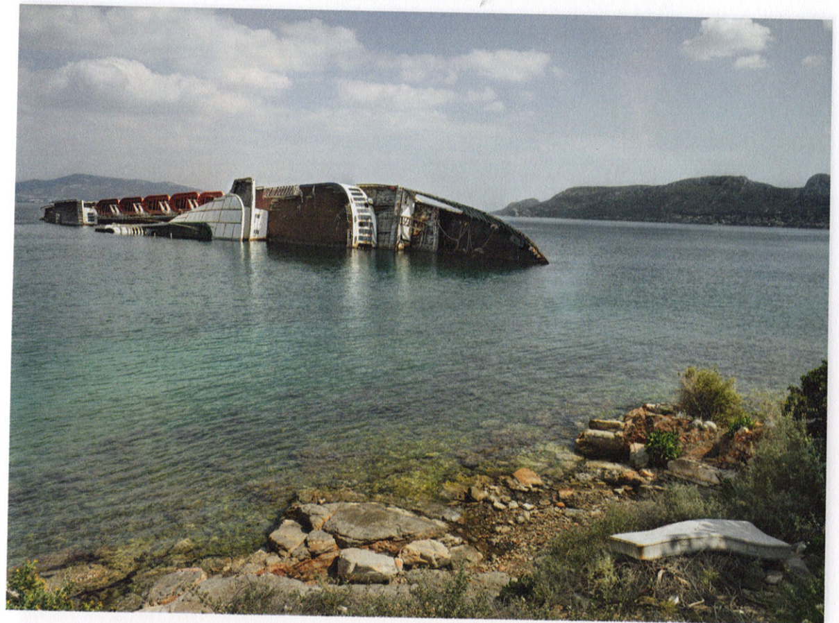
Carl De Keyzer, Elefsina, Griekenland, uit het boek Moments before the Flood (Lannoo, 2012). Zie het artikel op p. 108 e.v.