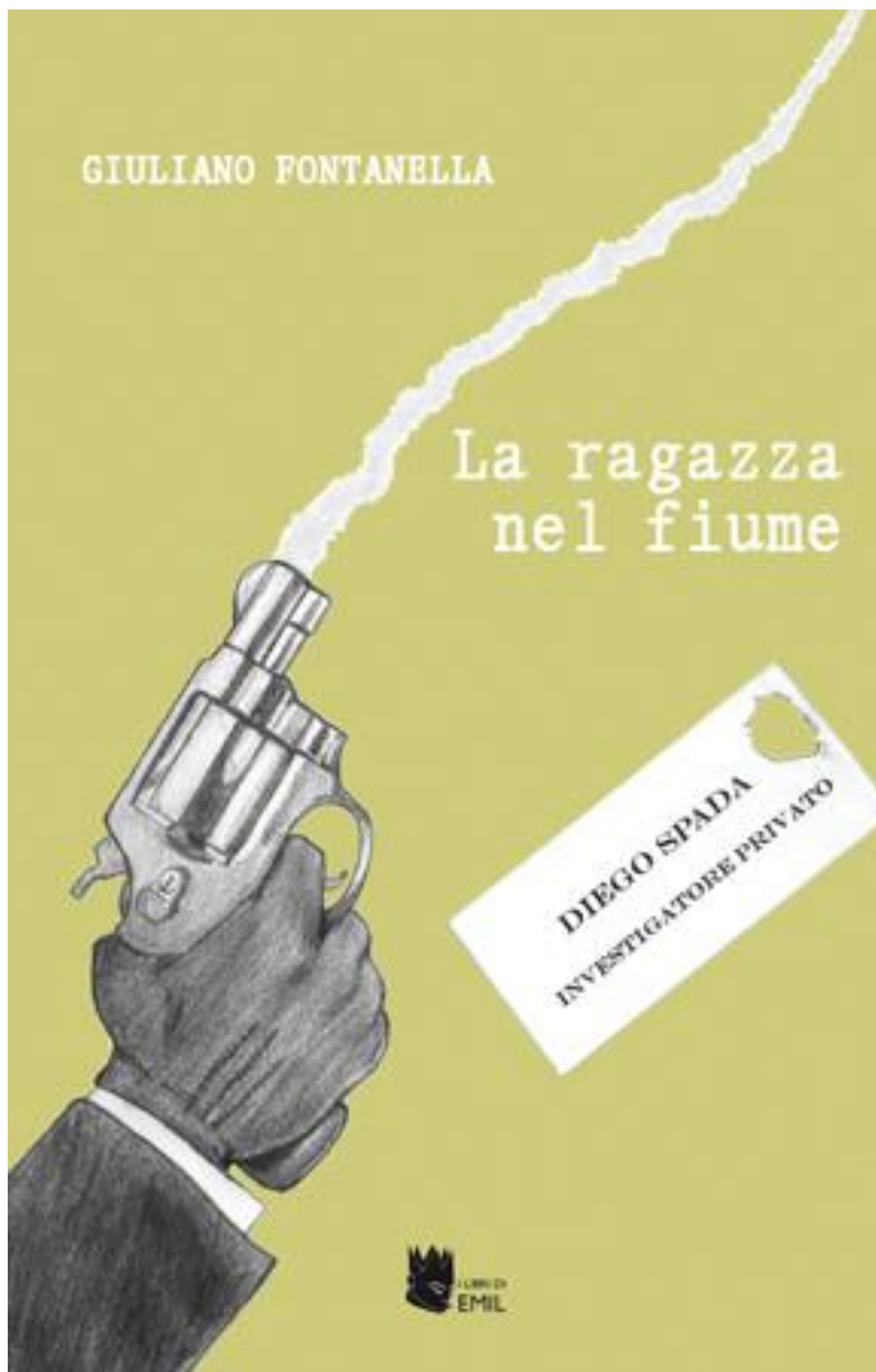
La ragazza nel fiume di Giuliano Fontanella, I libri di Emil, 2014

PUBBLICAZIONI LETTERARIE DI GIULIANO FONTANELLA: