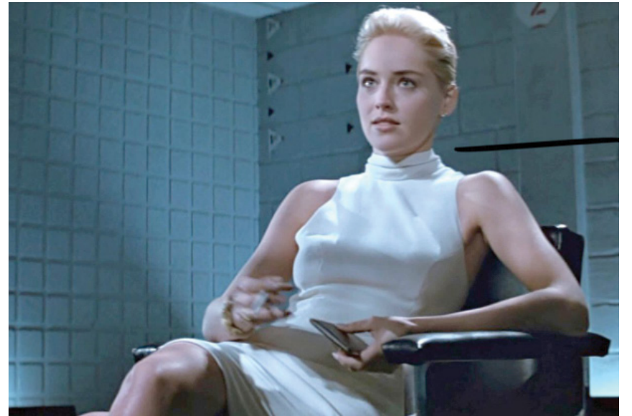
שרון סטון בסצנת החשיפה המפורסמת ב"אינסטינקט בסיסי". חשה שהבמאי רימה אותה

דווקא על רקע משפטו של המפיק המושמץ הארווי וויינשטיין, שמתנהל כעת בניו יורק ובמרכזו אישומים כבדים של תקיפה והטרדה מינית של יותר מ-80 נשים (14 מהן טוענות שנאנסו על ידיו), מעניין לבחון את ההשפעה המצטברת של עידן MeToo על הוליווד כולה, מעבר לעונשי ה"הדחה" הנודעים של השחקן קווין ספייסי, הקומיקאי לואי סיקי, המגישים מאט לאוור וצ'רלי רון, ועוד כמה בכירים בעולם הטל-וויזיה בארה"ב שסרחו ביחסם לקולגות או לכפופים להם. פרשת לאוור, אגב, שימשה השראה לעלילת