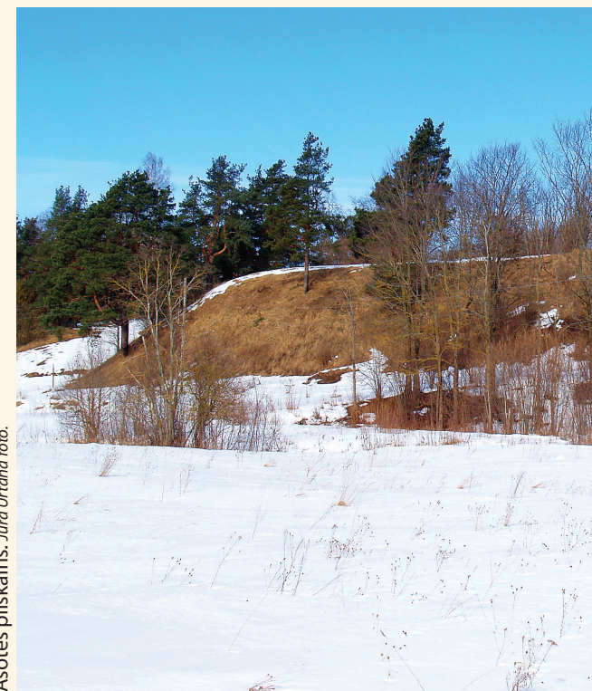
Asotes pilskalns.

© Juris Urtāns, teksts, 2019. © Krustpils novada pašvaldība, 2019. © Latvijas Arheologu biedrība, 2019.