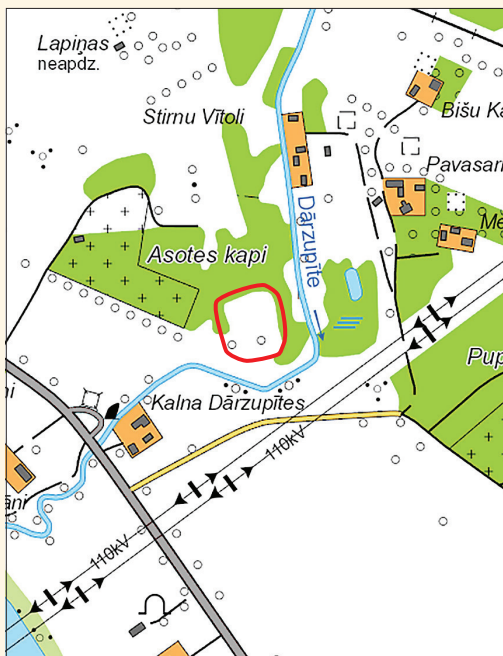
Asotes pilskalņa atrašanās vieta.