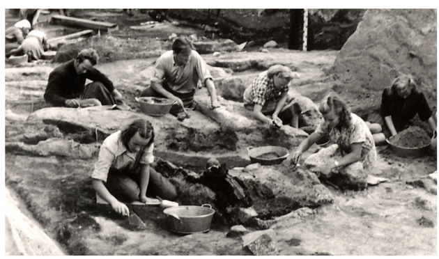
Arheoloģiskie izrakumi Asotes pilskalnā.