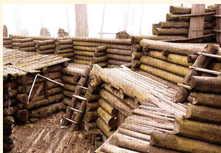
Asotes pilskalna aizsargsienas rekonstrukcija Lielvārdes Uldevena pilī.

Izrakumos atklāja uz 10. gs. attiecināmu, labi saglabājušos dzelzs ieguves krāsnis, ogļu dedzināmās bedres un kalves paliekas.