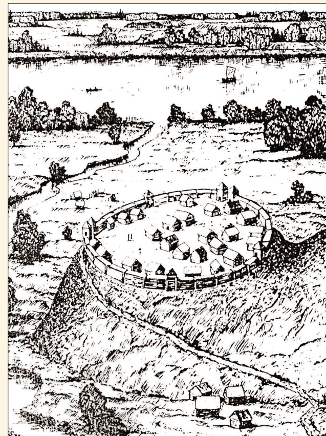
Asotes pilskalna apbūve.

Pilskalna plakuma vidū atsegta bedre ar dzīvnieku kauliem un monētām uzskatāma par upurbedri, kur ziedots ēdiens, dzēriens un dažādas lietas.