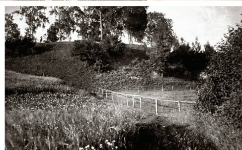
Asotes pilskalns pirms Otrā pasaules kara.