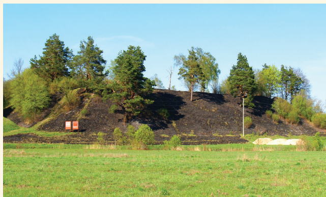
Asotes pilskalns.

senākās vēstures speciālistu – arheologu kalve.