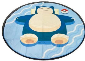
カビゴンの特大 レジャーシート

※チャレンジ条件を達成した方に、アプリ内の「お知らせ」で抽選のエントリーフォームをご案内いたしますので、必要情報の入力およびご応募をお願いいたします。