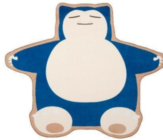
ダイカットごろ寝 タオルケット