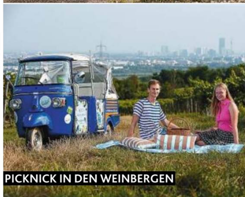
PICKNICK IN DEN WEINBERGEN

Mit einer offenen italienischen Ape Calessino geht es vom 1. Bezirk nach Stammersdorf in die Weinberge – traumhafter Wienblick inkludiert!