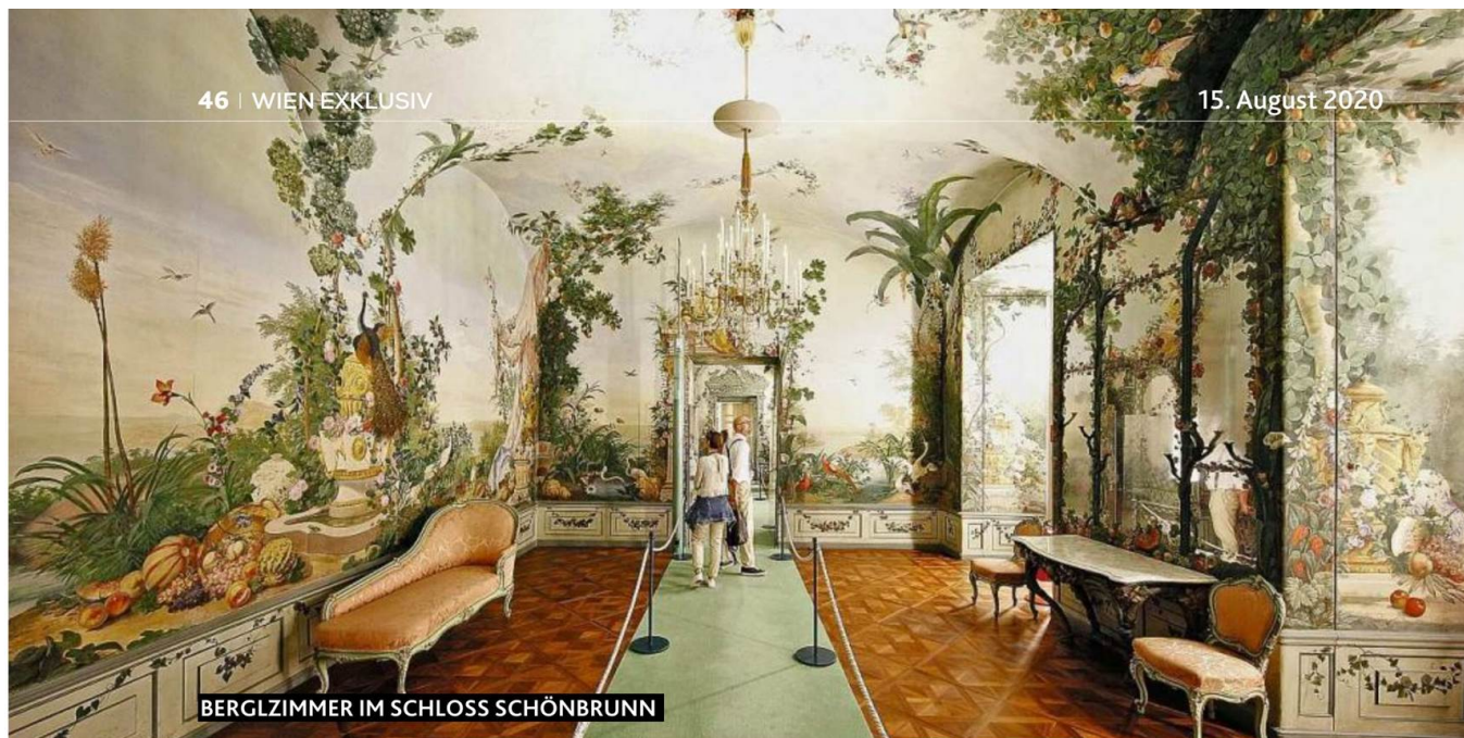
BERGLZIMMER IM SCHLOSS SCHÖNBRUNN

Touristen-Attraktion Nummer eins: Schönbrunn mit den Berglzimmer.