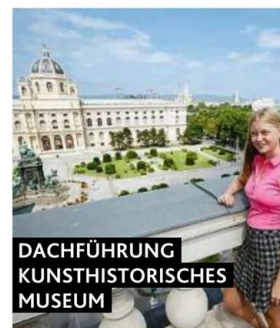
DACHFÜHRUNG KUNSTHISTORISCHES MUSEUM

Also auf nach Schönbrunn, das Touristenziel Nummer eins. Normalerweise besuchen das Schloss zwischen 8000 und 10.000 Menschen, täglich wohlgemerkt. Nun ist diese Zahl natürlich um ein Vielfaches niedriger, aber es gibt auch etwas Besonderes, nämlich erstmals die Gelegenheit für Individualbesucher, die Bergzimmer zu besuchen. Maria Theresia litt im zunehmenden Alter immer mehr unter der sommerlichen Hitze und ließ sich deshalb im Erdgeschoß des Schlosses Räume einrichten, die der böhmische Maler Johann Wenzel Bergl mit exotischen Landschaftsmalereien ausstattete. Bis jetzt waren diese prächtigen Zimmer nicht allgemein zugänglich, nur im →