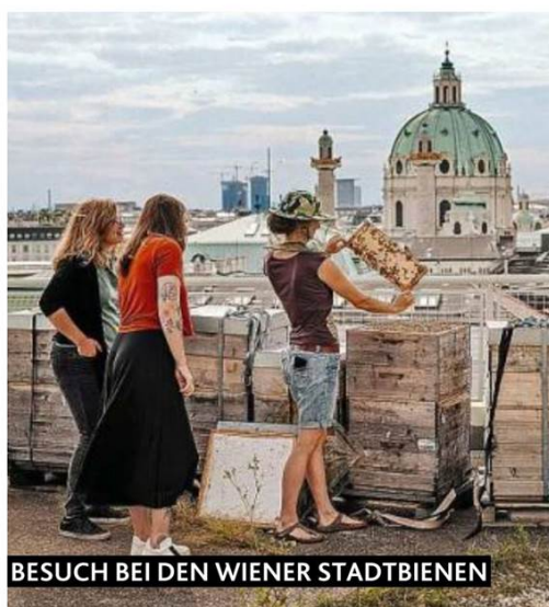
BESUCH BEI DEN WIENER STADTBIEEN

Wer die Wahl hat, hat die Qual: Picknick in den Weinbergen mit einer lustigen Ape-Anreise, ein virtuelles Abenteuer bei First Escape, Besuch bei den Wiener Stadtbienen oder in der Zuckerwerkstatt, vielleicht ein orientalischer Kochkurs mit Wiener Schmah bei Habibi & Hawara, die Erlebnisse sind sehr abwechslungsreich – am besten alles durchprobieren, die „Vienna City Card Experience Edition“ gilt ja ein Jahr lang! ■