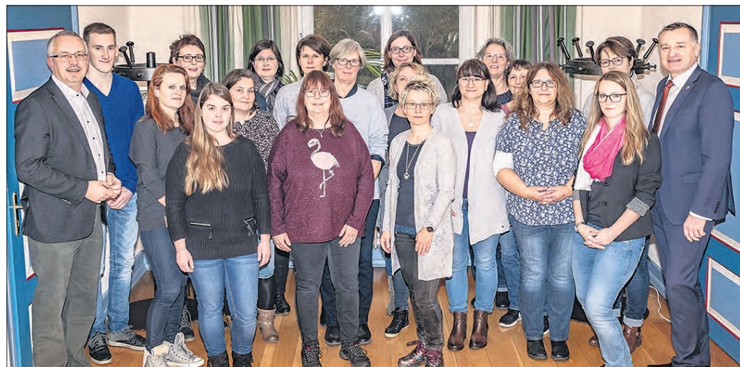
Vertreter der Soltauer Kindertagesstätten und Mitarbeiter der Stadtverwaltung haben ein neues Anmeldeverfahren für die Kindertagesstätten entwickelt.