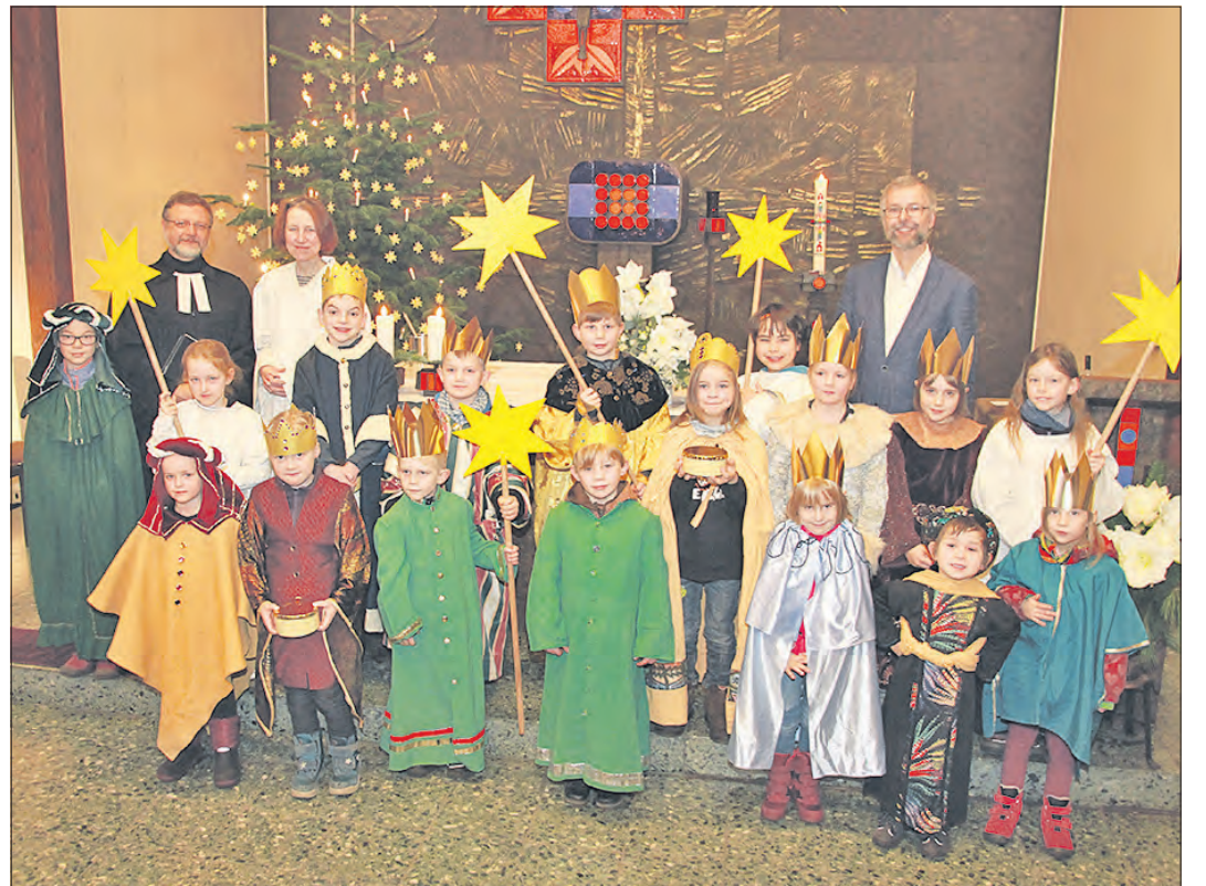
Schrieben den Segen an mehr als 90 Häuser: Die 18 Kinder der ökumenischen Sternsingeraktion in Hermannsburg haben Anfang des Jahres insgesamt 1.950 Euro gesammelt.

Für das Kindergartenjahr 2019/2020 müssen Eltern ihre Kinder vom 14. bis zum 26. Januar anmelden. In dieser Zeit ist dies auf der Internetseite www.soltau.de/kitaanmeldung möglich. Eltern ohne Internetzugang haben nach wie vor die Möglichkeit, das Formular in Papier-Form zu erhalten.