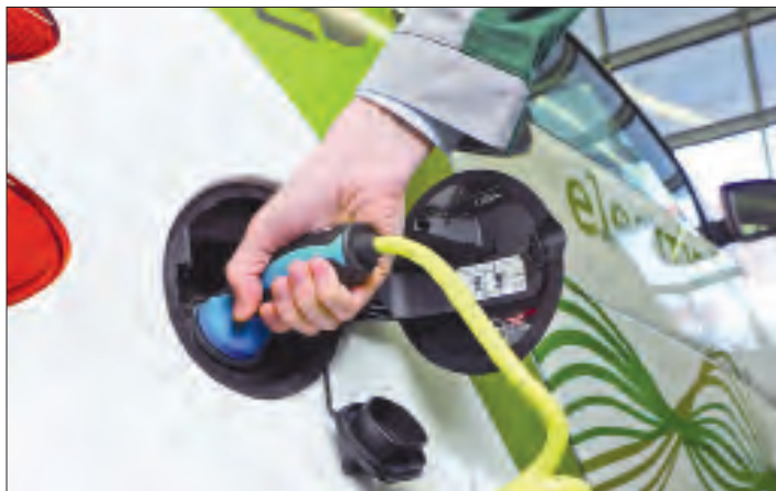
Besser vorheizen: Mit temperierter Batterie lässt sich beim Elektroauto eine höhere Reichweite erzielen.

Im Winter geht mit den Temperaturen auch die Reichweite von Elektroautos und Pedelecs in den Keller.