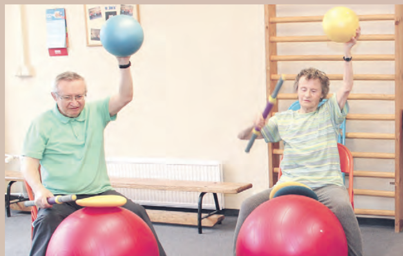
In der Tagespflege kann man gemeinsam mit anderen Bewegungs- und Sportangebote nutzen.

Der Pflegebedürftige lebt weiterhin zu Hause, kann aber einige Stunden, einen Tag oder mehrere Tage in der Woche in einer Pflegeeinrichtung verbringen, mit anderen Menschen zusammenkommen, gemeinsam singen, spielen, spazieren gehen oder essen. Außerdem sollten pflegerische und medizinische Versorgung durch Fachpersonal gesichert sein. In der Regel organisiert die Einrichtung einen Fahrdienst, der die Besucher morgens abholt und später wieder nach Hause bringt. Manche Einrichtungen bieten auch Betreuung über Nacht an. Das ist hilfreich, wenn der Pflegebedürftige nachts sehr unruhig ist und der Angehörige deshalb nicht durchschlafen kann. Für Tages- und Nachtpflege ist ein gesonderter