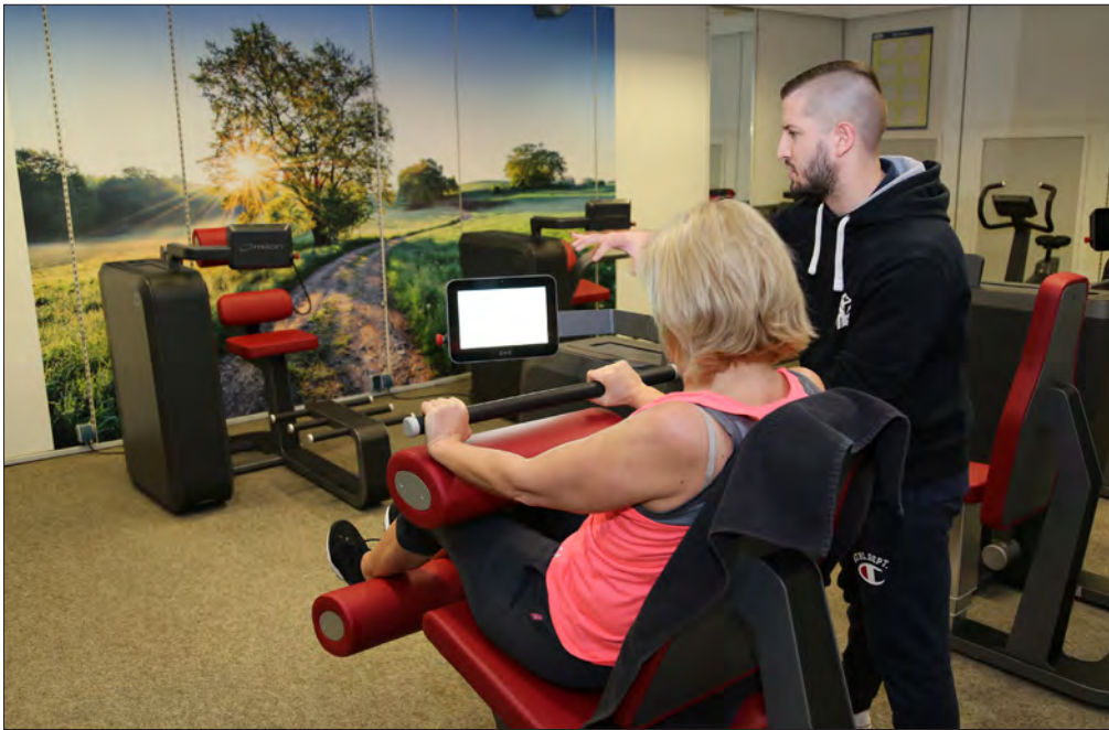
Neu im Schneverdinger Physiotherapie-Zentrum: der neue „Q-Zirkel“.