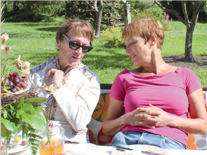
Wird ein Angehöriger pflegebedürftig, sollte man in Ruhe darüber sprechen, wie die Betreuung durch Familienmitglieder am besten organisiert werden kann.