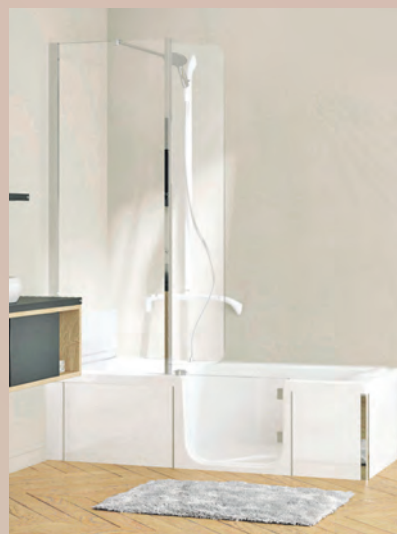
Ob der Sinn nach einem ausgiebigen Bad steht oder erfrischendem Duschen: beides ist möglich.