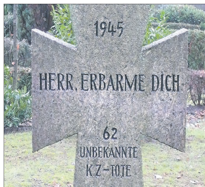
Das Granitkreuz für die 62 KZ-Toten auf dem „Neuen Friedhof“ in Schneverdingen.

„Neuen Friedhof“ bestatten mußten.“ Eine „offene Diskussion“ über das Thema habe es in der Heideblütenstadt erst nach der Ausstrahlung des amerikanischen Films „Holocaust“ im Jahr 1979 im deutschen Fernsehen und nach der Rede des Bundespräsidenten Richard von Weizsäcker zum „40. Jahrestag der Befreiung“ im Jahr 1985 gegeben. So sei seinerzeit nach einer Ausstellung und einer Veranstaltungsreihe mit teilweise kontrovers ausgetauschten Meinungen im Theeshof auch das jetzt wieder neu aufgelegte Buch „Nur Gott der Herr kennt ihre Namen“ über die KZ-Züge auf der Heidebahn entstanden. „Es ist gut, daß diese Fakten noch rechtzeitig vor Eröffnung des Mahnmals am Bahnhof bekannt wurden und so noch auf den Informationstafeln berücksichtigt werden konnten“, betont der Ratsvorsitzende.