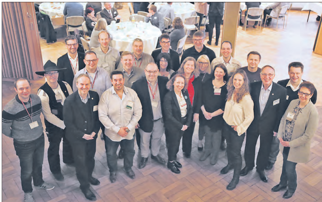
Die derzeit 21 Mitglieder der Soltauer BNI-Unternehmergruppe sowie Vertreter der „Chapter“ aus Walsrode und Buchholz hatten zur Gründungsveranstaltung ins Hotel Meyn eingeladen.

Zum Treffen gehörten unter anderem Firmenpräsentationen von je etwa einer Minute Länge und der Austausch von Visitenkarten. Wer die Arbeit der anderen und deren Angebote besser kennenlernen will, muß übrigens auch weiterhin früh aufstehen: „Die Soltauer BNI-Mitglieder treffen sich jede Woche Donnerstag früh am Morgen um 7 Uhr im Hotel Meyn“, lud Petschull ein.