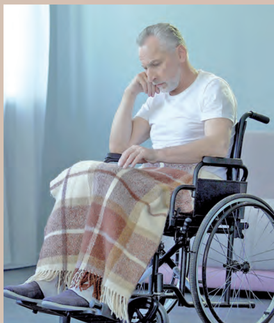
Wie alt auch immer Menschen einst werden mögen. Am Ende droht (vermutlich unausweichlich) Demenz.

„Derzeit ist noch unklar, ob der rückläufige Trend sich bestätigen wird“, sagt Dr. Bickel, „in jedem Fall aber werden die demografischen Veränderungen dafür sorgen, dass die Krankenzahl in den nächsten Jahrzehnten nicht sinkt“.