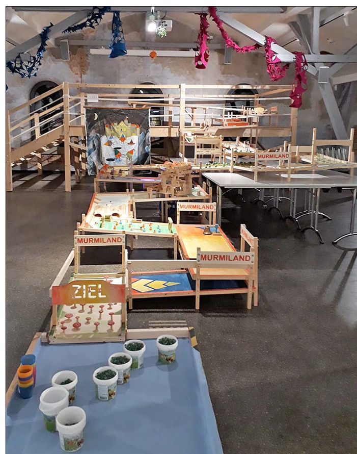
Auf der Riesenmurmelpfadbahn in der Filzwelt Soltau gibt es am 23. Februar zum Abschluß der Murmelwochen ein Wettrennen der Glaskugeln.

Geschick und Glück sind bei den verschiedenen Flipperrn gefragt: Mal gilt es, mit dem richtigen Murmeltreffer Hänsel aus dem Käfig der Hexe zu befreien, mal absolvieren die Glaskugeln einen Minigolfparcours. Besonders komplex ist die Mechanik der Kurbelbahnen; hier brauchen die Spieler Fingerspitzengefühl und den richtigen Rhythmus, um die Kugeln wie bei der Murmelachterbahn Stufe für Stufe zum Startpunkt zu kurbeln.