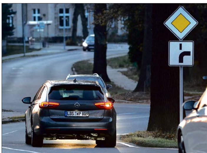
Über alle Verkehrssituationen hinweg blinken laut Dekra nur 50 Prozent aller Fahrerinnen und Fahrer richtig.