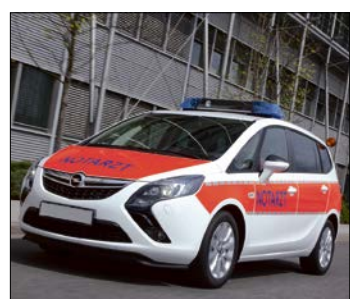
Im Straßenverkehr ist gutes Hören wichtig.

Während ein Sehtest bei der Führerscheinprüfung per Gesetz vorgeschrieben ist, ist der Hörtest freiwillig. Vielen Fahranfängern und „Langzeit-Fahrern“ ist deshalb gar nicht bewusst, dass ein Check der Ohren ebenfalls eine wichtige Maßnahme wäre, mahnt die Bundesinnung der Hörakustiker (biha).