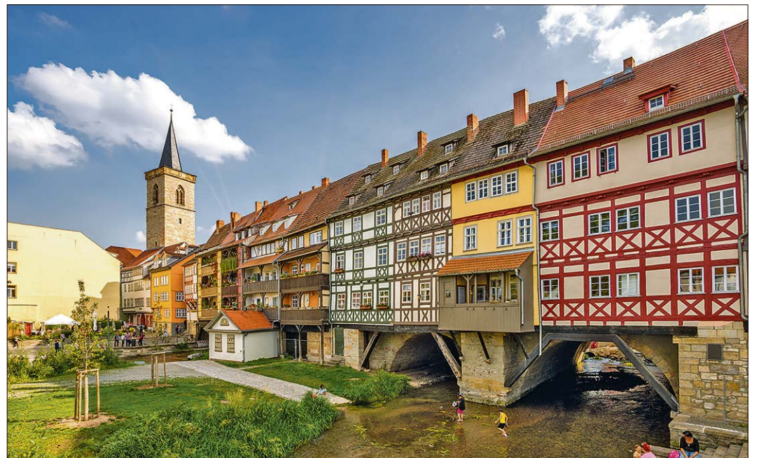
Die berühmte Krämerbrücke in Erfurt: Die thüringische Landeshauptstadt besuchen die Heidjer auf der Heimfahrt.

SOLTAU (mwi). Thüringen - das sind dichtbewaldete Höhen, idyllische Täler und stille Dörfer, aber auch Städte von europäischem Rang wie Erfurt und Weimar - das ideale Ziel also für Entdeckungen vom Fahrradsattel aus. Dafür möchten wir auch Sie, liebe Leserinnen und Leser, begeistern: Lernen Sie die schönsten Flecken dieses Bundeslandes auf unserer Leserradreise „Thüringen“ vom 30. Juni bis zum 5. Juli 2019 kennen. Für 795 Euro (pro Person im Doppelzimmer bei Halbpension) können Sie sich diese außergewöhnliche Region erradeln. Mit modernem Bus und Fahrradanhänger machen sich die Heidjer auf den Weg. Ziel ist das Leonardo-Hotel Weimar, wo sie während der Reise wohnen. Buchen können Sie diese Leserreise ausschließlich beim Heide-Kurier, Kirchstraße 4, 29614 Soltau, Telefon (05191) 98320. Hier bekommen Sie auch weitere Informationen.