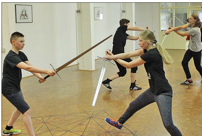
Die Grundlagen des Langschwertfechtens werden im April in einem Seminar in Soltau vermittelt.

kunst in einem Wochenendseminar in Soltau widmen. Gutzeit lehrt die Grundlagen des Langschwertfechtens von der richtigen Haltung über „Grundhaue“ und Paraden bis hin zu Entwaffnungstechniken. Außerdem geht es um alles, was sonst als Basis für die historische Fechtkunst wichtig ist. Gutzeit beschäftigt sich seit mehr als 20 Jahren mit europäischen, historischen Kampfkünsten und leitet die Schule „Klopffechters Erben“. Er bietet vom 6. bis zum 7. April von 10 bis 16 Uhr in Soltau in der Sporthalle des Gymnasiums ein Seminar für Anfänger im Fechten mit dem langen Schwert an. Weitere Infos finden Interessierte auf der Internetseite www.klopffechters-erben.de , über die auch Anmeldungen möglich sind.