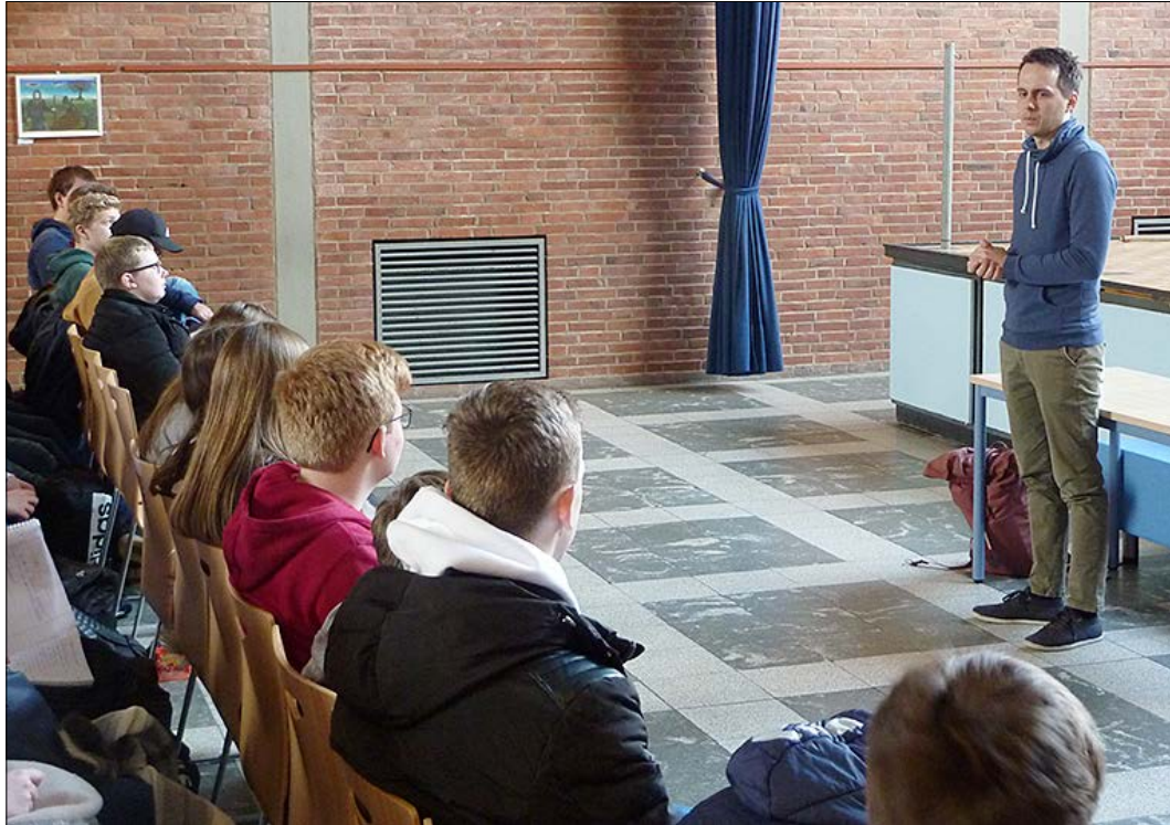
Bundestagsabgeordneter Sven-Christian Kindler (Grüne) stellte sich den Fragen der Schülerinnen und Schüler des Gymnasiums Munster.

Kindler (Grüne) zu Gast an Gymnasium Munster