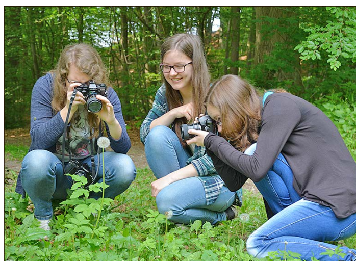
Schwarzweißfotographie steht im Mittelpunkt eines Seminars für Jugendliche.

Interessierte Jugendliche ab zwölf Jahren können sich noch unter der Telefonnummer (05162) 989811 oder per Email ( j.mehmke@jugendhof-idingen.de ) über die Seminare informieren oder sich gleich anmelden.