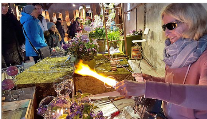
Viel zu entdecken: Mehrere Kunsthandwerker lassen sich bei der Arbeit über die Schulter schauen.

BAD FALLINGBOSTEL. Unter dem Titel „Handgemacht“ steht der Markt für Kunsthandwerk, Design und Kurioses, bei dem am kommenden Wochenende rund 70 ausgesuchte Aussteller ihre Arbeiten präsentieren. In der Heidmarkhalle in Bad Fallingbostel sind am 23. und 24. Februar Designer, Künstler, Kunsthandwerker und Anbieter besonderer Dinge aus der gesamten Bundesrepublik zu Gast. Am Samstag von 10 bis 18 Uhr und am Sonntag von 11 bis 18 Uhr zeigen die Kreativen an ihren Ständen Werke aus der eigenen Werkstatt oder dem eigenen Atelier sowie neueste Trends wie Vintage und nachhaltiges Design. Ein großes Spektrum nimmt in