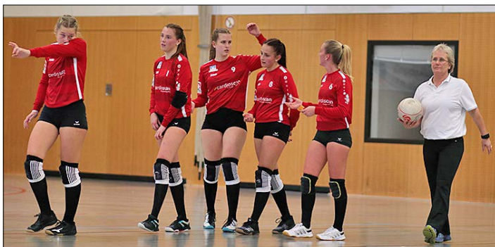
Spielt heute in der KGS-Halle: das Bundesligateam vom TV Jahn.

Derzeit belegt der TV Jahn mit 16:12-Zählern punktgleich mit dem SV Moslesfehn den 5. Tabellenplatz. Da der SVM als Ausrichter der Deutschen Meisterschaft von einem Freiplatz für die Titelkämpfe profitiert, qualifizieren sich in dieser Saison nur die beiden ersten Mannschaften der Bundeliga Nord. Hier hat der TV Brettorf bereits das Ticket gelöst. Im Kampf um Platz 2 liefern sich der VfL Kellinghusen (22:6-Punkte) und der Ahlhorner SV (18:10) ein Fernduell.