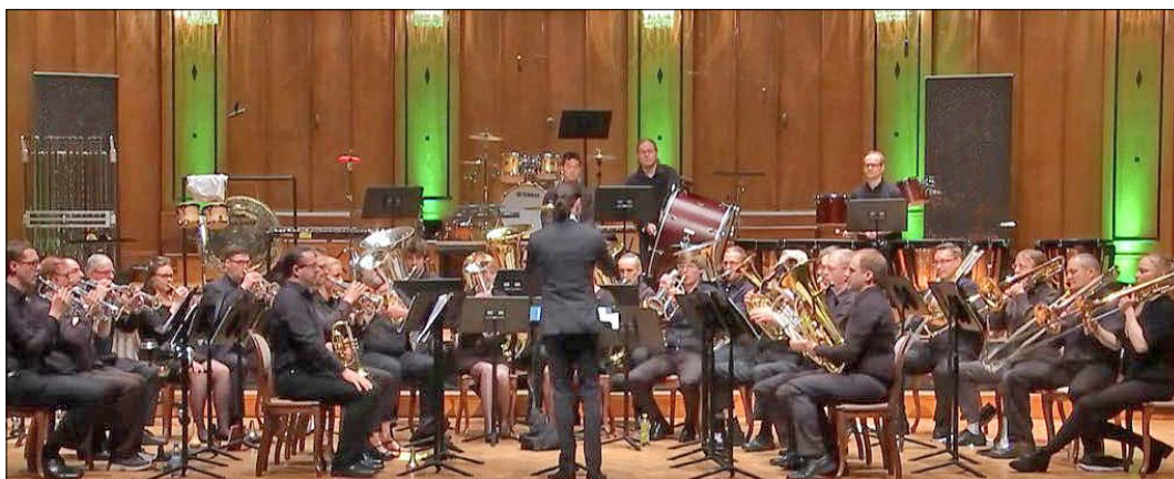
Die „St. Stephan Brass Band Hamburg“ gibt am Sonntag, dem 23. Juni, um 17 Uhr in der Dorfmarker St. Martinskirche ein Konzert.

DORFMARK. Auch in diesem Jahr reist die „St. Stephan Brass Band Hamburg“ in die Lüneburger Heide, um in der Dorfmarker St. Martinskirche ein Konzert zu geben: Am Sonntag, dem 23. Juni, um 17 Uhr, können Besucher sich vom einzigartigen Klang einer Brass Band in „klassischer englischer“ Besetzung überzeugen.