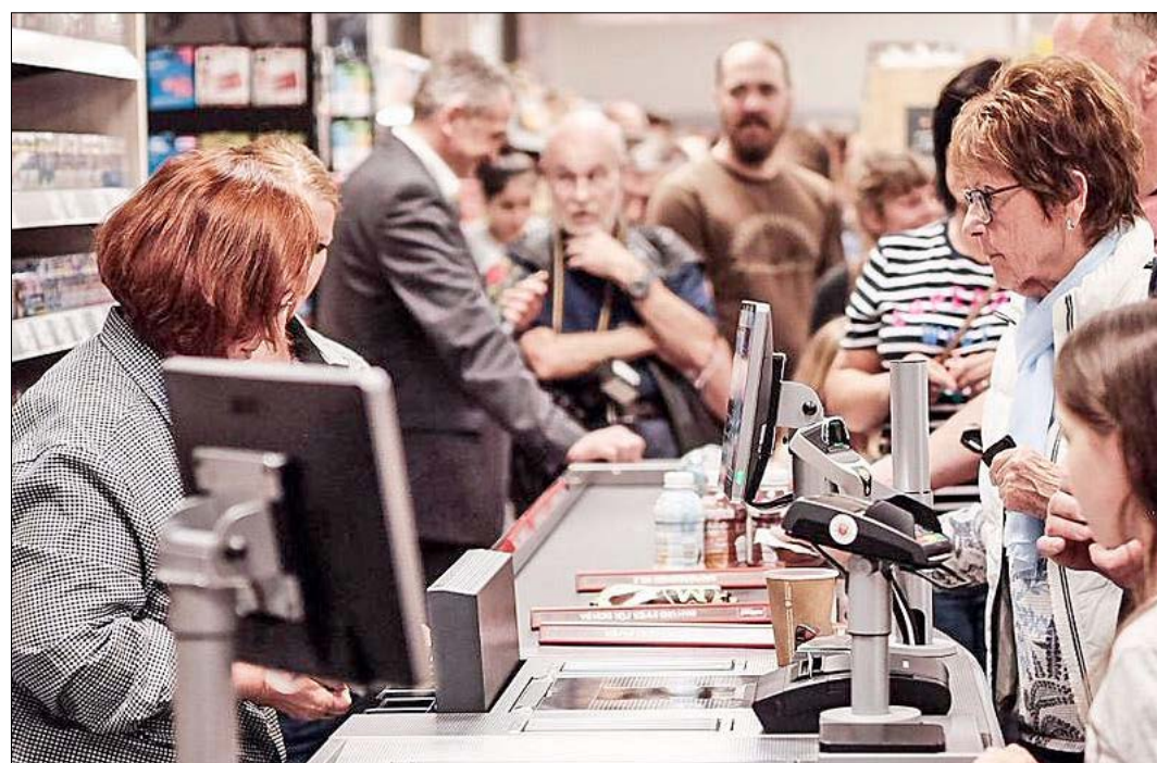
Viele neugierige Müdener wollten bei der Eröffnung „ihr“ Bürgerprojekt, den „Tante Hanna“-Markt, kennenlernen.

„Tante Hanna“ sei kein „Lebensmittelmarkt von der Stange“, so Gebers weiter. Alle Beteiligten hätten „mit sehr viel Liebe zum Detail viele Elemente der Einrichtung und der Dekoration in Eigenleistung erstellt, die alle für sich Unikate sind. Es ist etwas Besonderes. Es ist eine Mischung aus Landhausdiele, Biomarkt und klassischen Supermarkt.“ In den kommenden Wochen sollte weiter an einigen Elementen gearbeitet werden, etwa einem Bereich mit Tischen und Sitzbänken an der großen Eiche vor dem Marktgebäude. Angeboten werden in dem Dorfladen vor allem