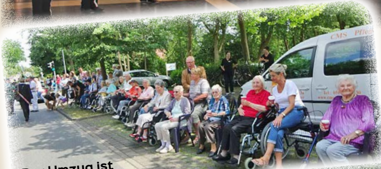
Der Umzug ist wieder einer der Höhepunkte des Schützen- und Volksfestes in Munster.

Vom morgigen Donnerstag bis zum kommenden Sonntag feiern die Munsteraner Schützen in diesem Jahr ihr traditionelles Fest.