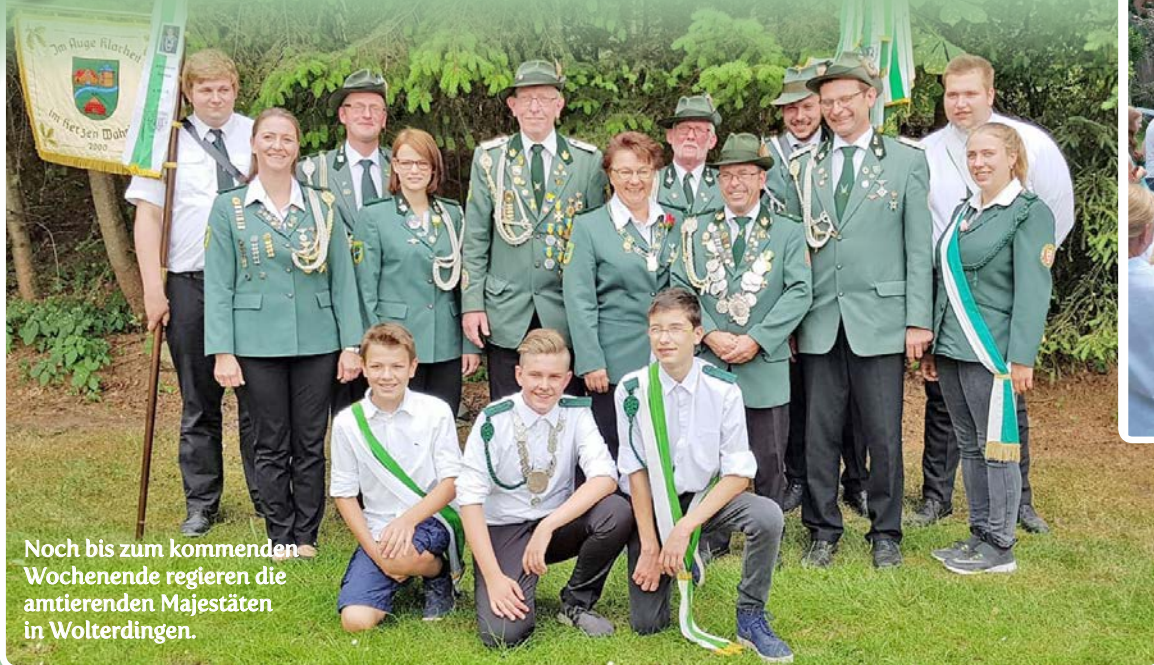
Noch bis zum kommenden Wochenende regieren die amtierenden Majestäten in Wolterdingen.

Ein buntes Programm haben die Organisatoren für das diesjährige Fest des Schützenvereins Wolterdingen vorbereitet.