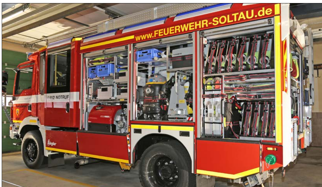
Modernes Löschgruppenfahrzeug mit allem Drum und Dran: das neue LF 20 KatS der Freiwilligen Feuerwehr Soltau.