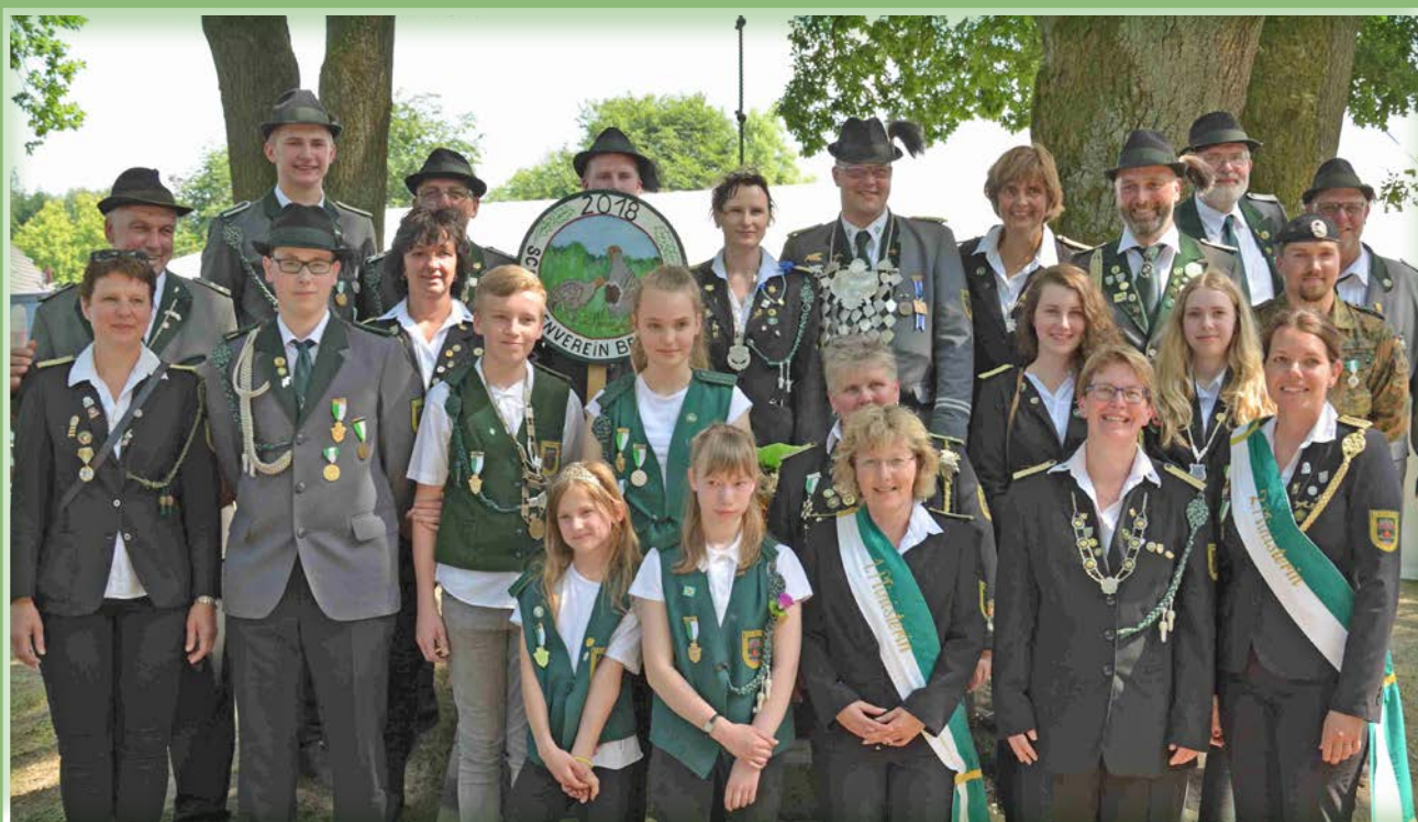
Gruppenbild der Würdenträger: Die Behringer Schützen versprechen für das kommende Wochenende wieder ein buntes Programm für jung und alt.

Mit dem Katerfrühstück im Festzelt beginnt am kommenden Montag, dem 17. Juni, ab 9.30 Uhr der letzte Tag des diesjährigen Schützenfestes. Um 11.30 Uhr folgt dann das Königsschießen, die Proklamation steht um 14.30 Uhr auf dem Programm. Anschließend marschieren die Schützen gemeinsam zum neuen Regenten. Zum Abschluß des mehrtägigen Programms kann ab 19 Uhr im Festzelt noch einmal ordentlich getanzt und gefeiert werden. Für ausgelassene Stimmung sorgt die Formation „Dube“. Der Eintritt ist frei.