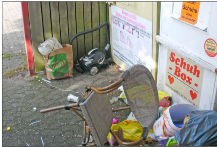
Illegale Müllentsorgung im Soltauer Achtergang.

Alte Matratze, Stühle, defekter Staubsauger und Plastiktüten mit Hausmüll - als Buchholz im Sommer wieder einmal auf illegal abgelegten Müll im Achtergang aufmerksam wurde, wandte er sich an alle möglichen Stellen. Mit Erfolg: „Die Firma, die dort die Container aufstellt, hat das dann alles wieder in Ordnung gebracht“, berichtet der Soltauer, der allerdings auch schon andere Mutwilligkeiten beobachten konnte: „So haben Leute Flaschen zerschlagen und die Scherben dann in den Kleidercontainer geworfen, wahrscheinlich, damit sich andere, die den Container nutzen, daran verletzen sollten.“