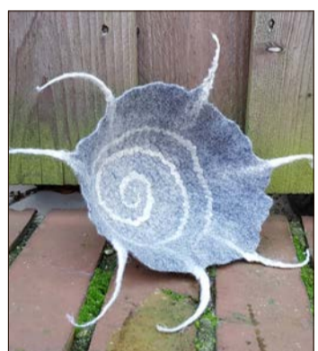
Schalen aus Filz stehen beim Workshop am 9. November im Fokus.

Informationen, Preisaukündigungen und Anmeldung für beide Kurse unter Telefon (05191) 9737581 oder per E-Mail an filzen@filzwelt-soltau.de.