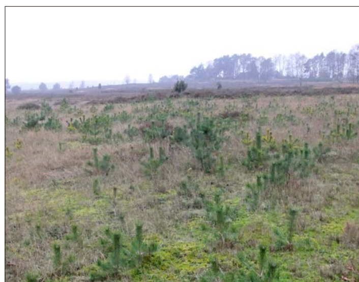
Wird am Samstag entkusselt: Eine Heidefläche, in der sich reichlich Kiefern-Wildwuchs breitgemacht hat.