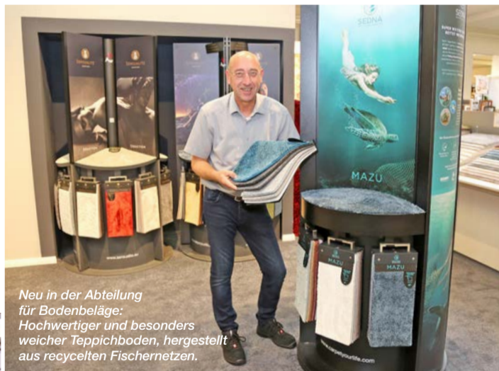
Neu in der Abteilung für Bodenbeläge: Hochwertiger und besonders weicher Teppichboden, hergestellt aus recycelten Fischernetzen.