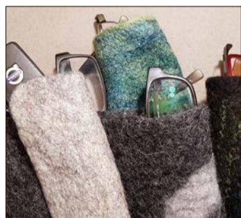
Am 20. November stehen kleinere Formate im Mittelpunkt eines Abendkurses.

Am Samstag, dem 9. November, stehen vergleichsweise große Objekte auf dem Programm - und die erfordern einige Ausdauer. Deshalb ist für den Kurs ein ganzer Tag (von 10.30 bis 17.30 Uhr) angesetzt. Entstanden kann eine Schale oder auch eine Hohlform - robust und vielseitig in der Verwendung, beispielsweise als Wollbehälter, Katzenhöhle oder Dekorationsobjekt. Je nachdem, welche Form gewünscht ist, wird in Schablonentechnik gearbeitet oder