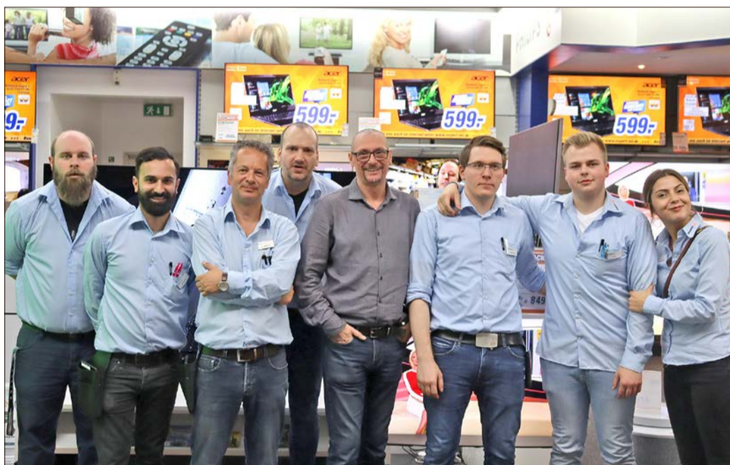
„expert“ in Soltau feiert seinen 18. Geburtstag - und das ganze Team des Elektronikfachmarktes feiert mit.

Für den 18. Geburtstag haben die „expert“-Mitarbeiter zahlreiche Angebote und Aktionen vorbereitet: In den kommenden Wochen lohnt es sich also, im Elektronikfachmarkt vorbeizuschauen.