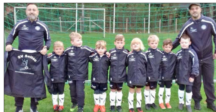
Die U7-Fußballer vom SV Soltau absolvierten vor kurzem ihren letzten Spieltag der Hinrunde. Auch am letzten Spieltag blieben die jungen Kicker ohne Punktverlust und dominierten das Spielgeschehen nach Belieben. Besonders erfreut zeigte sich das Trainerteam darüber, dass die Mannschaft zu einer Einheit zusammengewachsen ist und die Spieler bereits große Fortschritte in ihrer jungen fußballerischen Laufbahn vollzogen haben.