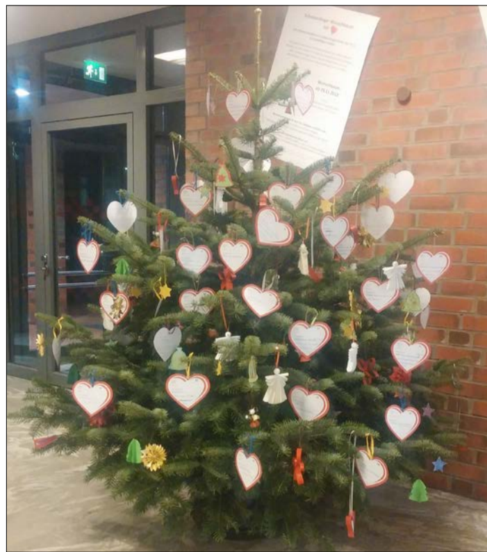
Wie im vergangenen Jahr sollen am Weihnachtsbaum in der Schneverdinger Kreissparkassen-Geschäftsstelle wieder viele Herzen mit Geschenkswünschen aufgehängt werden.