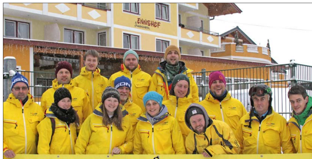
Freuen sich auf die Ski- und Snowboardfreizeit in Altenmarkt: die Übungsleiterinnen und Übungsleiter vom MTV Soltau.

Vom 26. Dezember dieses Jahres bis zum 3. Januar 2020 steht die nächste Ski- und Snowboardfreizeit auf dem Plan, die sich sowohl an Jugendliche ab 16 Jahren als auch an Erwachsene und Familien richtet. Je nach Schnee- und Wetterlage werden die Skigebiete von Flachau, Wagrain, Flachauwinkel, Altenmarkt-Radstadt und Zauchensee genutzt. Eine gemeinsame Silvesterfeier, der Besuch des örtlichen Spaß-