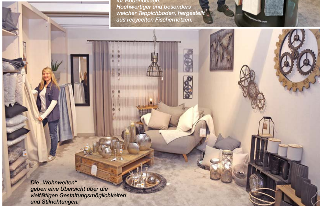
Die „Wohnwelten“ geben eine Übersicht über die vielfältigen Gestaltungsmöglichkeiten und Stilrichtungen.