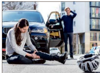
Im Notfall Ruhe bewahren und 112 wählen.

Täglich passieren in Deutschland unzählige Unfälle, sei es im Haushalt oder im Straßenverkehr. Im Notfall spielt derjenige die wichtigste Rolle, der als erster am Unfallort eintrifft. Laut Auswertung der repräsentativen Umfrage eines Mineralölkonzerns fühlen sich die Deutschen für den Ernstfall vorbereitet und schätzen die