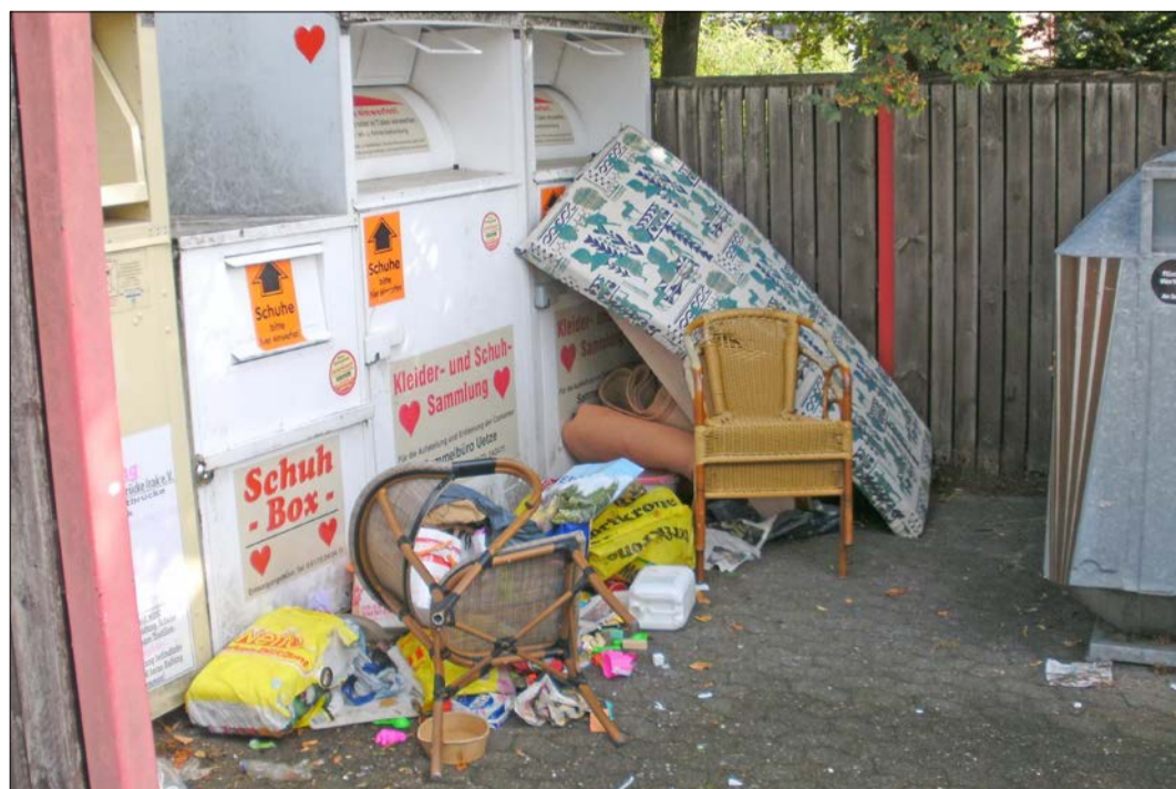
So sah es im Sommer vorübergehend auf dem Containerplatz im Achtergang aus.