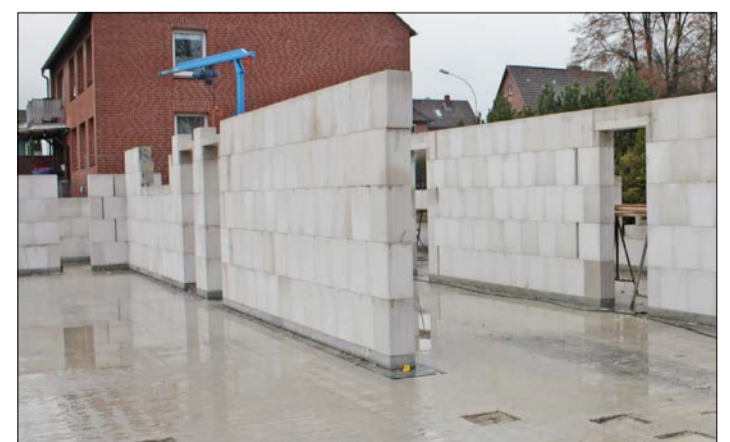
Bisher stehen ein nur paar Wände, aber zum August 2020 soll die neue Kita fertig sein.

So blicken denn alle auf den kommenden August, wenn die neue Kita öffnen soll. Dazu Architekt Krampitz: „Es gab einige Herausforderungen, so etwa, die rund 1.000 Quadratmeter Gebäudegrundfläche entsprechend unterzubringen oder das Grundstücksgefälle zu meistern. Aber bei der Einweihung werden wir sehen, dass dies ein tolles Gebäude mit einigen architektonischen Schmankerln geworden ist.“