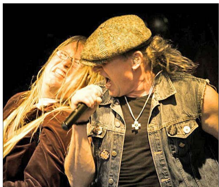
„Cheap Dirt“ heißt die „AC/DC“-Tributeband - und die spielt am 21. Dezember beim „Xmas Rock“ im Soltauer Band-Center.

Tickets erhältlich in der Soltau-Touristik GmbH und an allen bekannten WK-Stellen sowie direkt vom Veranstalter unter 0365-54 81 830 und www.spiritofwoodstock.de