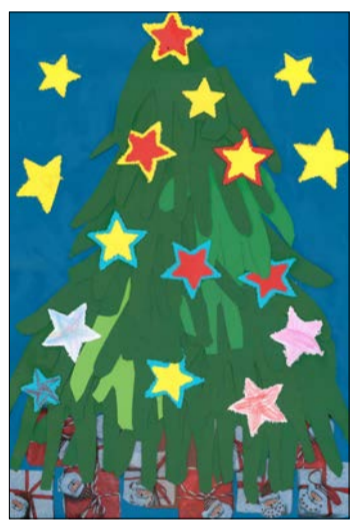
Diesmal öffnen die Grundschüler ein Türchen.

Wenn die Grundschülerinnen und -schüler in die Fußgängerzone kommen, dann singen sie nicht nur, sondern präsentieren ihren Zuschauerinnen und Zuschauern auch eine Tanzaufführung mit Rentieren und Weihnachtswichteln. Alle Soltauer sind dann eingeladen, dabei zusehen. Das gilt auch für den letzten dieser Termine am Freitag, dem 20. Dezember.