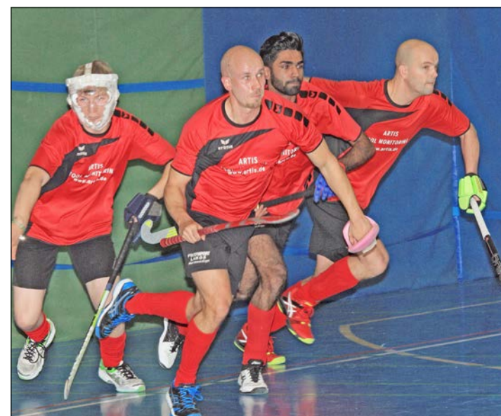
Spieler des MTV Soltau beim Verteidigen einer Strafecke.

MTV-Trainer Daniel Acker zog Bilanz: „Wir müssen an unserer Torabwehr arbeiten, haben wir doch zu viele Chancen nicht nutzen können, um siegreich zu sein.“ Der nächste Spieltag steht am heutigen Sonntag in Braunschweig auf dem Plan. Dort warten auf die Soltauer der Gastgeber Braunschweiger MTV und der DHC Hannover.