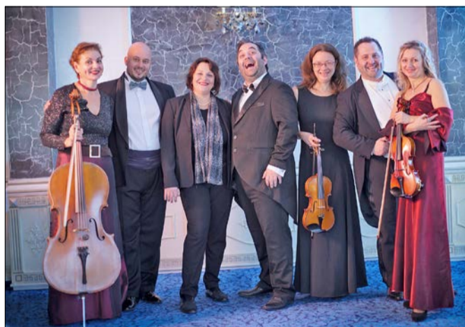
Für „Die himmlische Nacht der Tenöre“ am 3. Januar in der Eine-Welt-Kirche verlost der HK Freikarten.

SCHNEVERDINGEN. „Die Himmlische Nacht der Tenöre“ verspricht unter der Überschrift „Passione per la musica“ ein besonderes Konzert in der Eine-Welt-Kirche. Am 3. Januar ab 19.30 Uhr laden drei Opernsänger, live begleitet von einem Streichensembel, zu diesem Klassik-Highlight der besonderen Art nach Schneverdinger ein. Für „Die Himmlische Nacht der Tenöre“ verlost der Heide-Kurier dreimal zwei Freikarten.