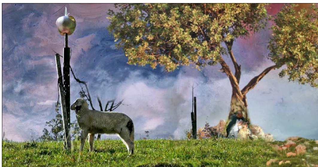
Im Schneverdinger Kurzfilmfestival „Lange Nacht der Kurzen“ zu sehen: „Die Herberge“.

Kurzfilmtag im Schneverdinger Kino „LichtSpiel“