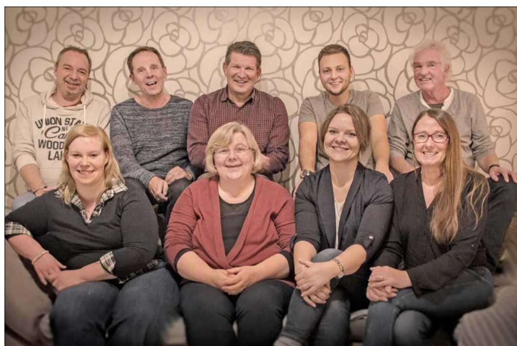
Proben bereits seit Anfang des Sommers für das neue Stück „Happy Birthday, liebe Alice“: die Mitglieder der Theatergruppe „Die Zeitlosen“.