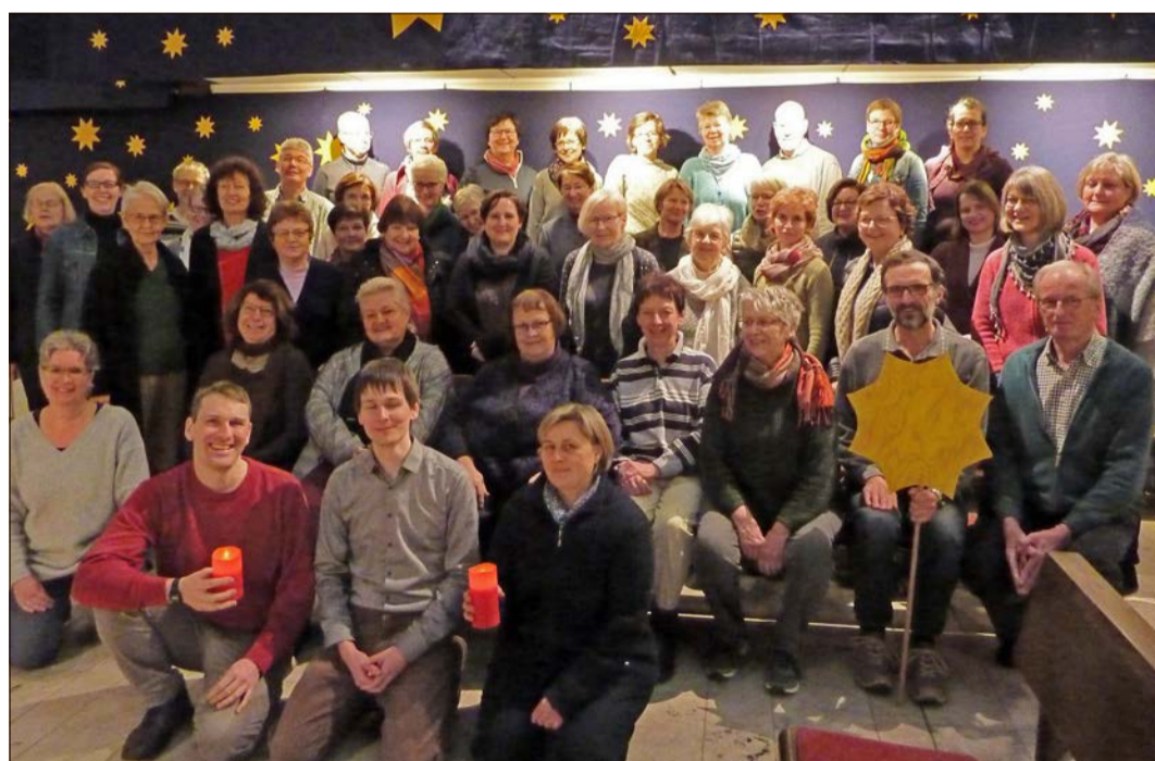
Die Stadtkantorei Soltau bereitet sich auf die Aufführung des französischen Weihnachtsoratoriums „Oratorio de Noel“ vor.

Französisches Weihnachtsoratorium von Saint-Saens