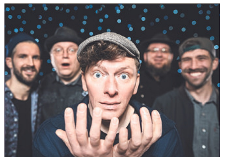
Gleich an zwei Tagen auf der Bühne im Böhmepark: Die Soltauer Band „Heavy Silence“.

„Heavy Silence“: Zweite Show im Böhmepark