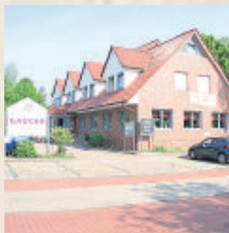
Am 1. Juni öffnete das Gauchos am Mühlenweg in Soltau nach mehr als sechsmonatiger Zwangspause wieder seine Türen.