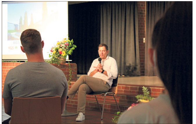
Lässiges Outfit, ernste Themen: Lars Klingbeil stellt sich in der KGS Schneverdingen den Fragen von Zwölfklässlerinnen und Zwölfklässlern.

Klingbeil tat alles, um den Jugendlichen jedwede Nervosität zu nehmen. Sie sollten einfach nicht darauf achten, dass dort hinten so viele Journalisten sitzen. Dem SPD-Generalsekretär war nämlich ein ganzes Rudel an Reportern aus Berlin in die Heide gefolgt, von der Vertreterin des ARD-Hauptstadtstudios bis zum Reporter der „taz“ war alles vertreten. Selbstverständlich war aber auch die Lokalpresse vor Ort. Die Schülerinnen und Schüler aus Politik-Kursen des zwölften Jahrgangs schienen sich ihre Fragen im Vorwege gut überlegt zu haben. Selbstsicher stellten sie diese ihrem Gegenüber, an das „Du“ wagte sich dann allerdings doch nicht jeder von ihnen heran. Wie zufrieden er denn mit der derzeitigen politischen Situ-