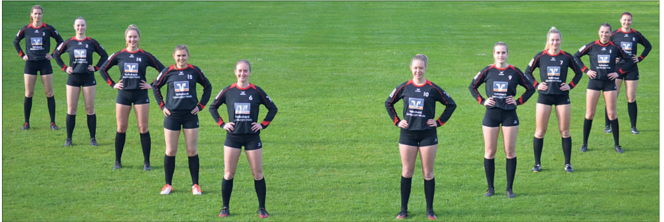
In Corona-Zeiten ein im wahrsten Sinne des Wortes breit aufgestellter Kader: Die Bundesliga-Faustballerinnen des TV Jahn Schneverdingen starten am heutigen Sonntag in die verkürzte Saison.

TV Jahn Schneverdingen startet in die neue Saison: Teilnahme an der Deutschen Meisterschaft das Ziel