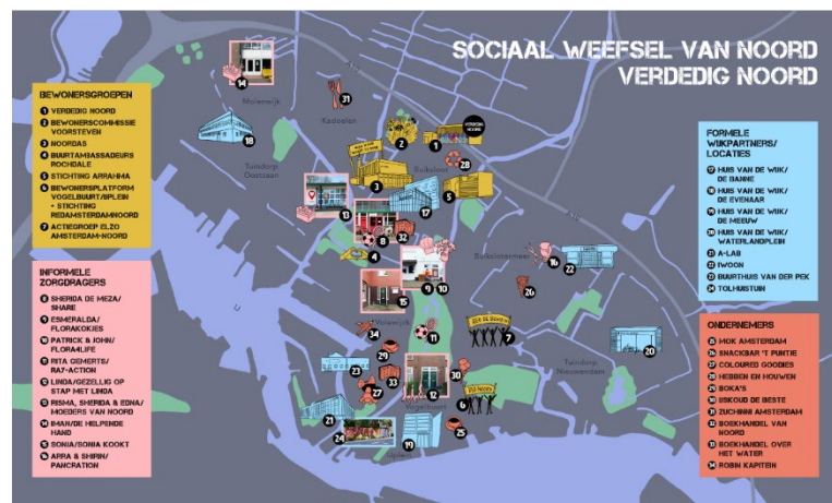
Figuur 2: Voorbeeld van een 'sociale infrastructuur', bestaande uit zowel informele als formele plekken, in dit geval van Amsterdam Noord.

Een architect die het altijd heeft over het belang van contact en interactie, is Herman Hertzberger. Sinds het begin van zijn loopbaan probeert hij ruimtelijke condities te scheppen voor de basale behoefte aan contact. Zijn bekendste ontwerp vondst is de tribunetrap, waarop je kunt zitten, werken en kletsen. Ook iemand als Jan Gehl heeft van uit die invalshoek pleidooien gehouden voor 'levendige plinten' bij hoogbouw en het idee om steden vooral 'op ooghoogte' te ontwerpen.