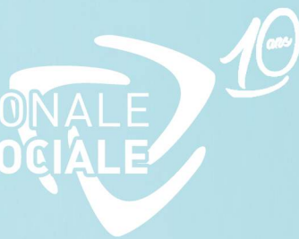
TABLE RÉGIONALE ÉCONOMIE SOCIALE Chaudière-Appalaches