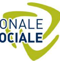
TABLE RÉGIONALE ÉCONOMIE SOCIALE Chaudière-Appalaches