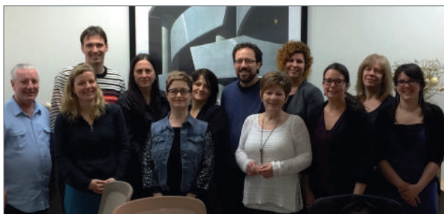
▲ Représentants des régions du Québec ayant participé au projet pilote.

La TRÉSCA, en partenariat avec les Corporations de développement communautaire (CDC) de la Chaudière-Appalaches, a terminé le projet pilote de Parcours professionnalisant pour les gestionnaires de l'économie sociale et de l'action communautaire. Initié en 2014 par le Comité sectoriel de main-d'oeuvre - Économie sociale et action communautaire (CSMO-ÉSAC), ce projet a permis dans un premier temps de former des formateurs régionaux sur le transfert des complétences dans les organisations, puis d'offrir des formations adaptées aux gestionnaires.