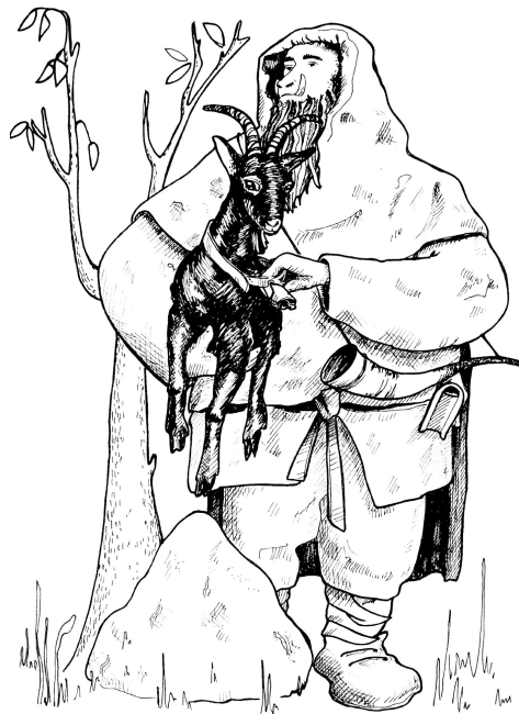
Illustrazione S. Brem

Link al sito: https://www.museovalverzasca.ch/tappa3