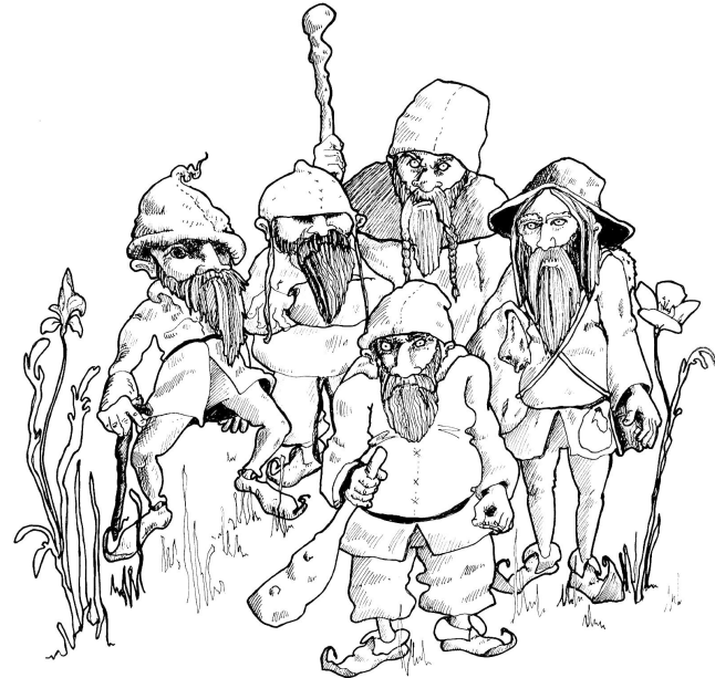
Illustrazione S. Brem

Link al sito: https://www.museovalverzasca.ch/tappa2