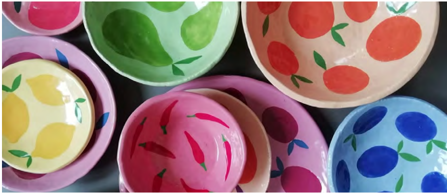
klo 12-18 (11.-12.5.2024) Suruttomain ry:n kevätmyyjäiset.

KLO 11.30-14 FARKKUSHORTSIEN JA MESIKÄMMENEN "LEIN" TUUNAUSPAJA Karhu puistossa Kannustetaan Suomi euroviisujen huipulle tuunaamalla farkuista shortseja Kallion Kulttuuriverkoston järjestämässä työpajassa Kallio Kukkii-festivaalien avajaispäivänä klo 11.30-14. Ylijäävästä materiaalista tehdään lei Karhuiston Mesikämmen-patsaille. Voit tuoda mukanasi yhden puhtaana farkut, joista haluat tuunata itsellesi shortsit. Huomio! Koska työpaja on ulkona katoksessa, paikalla ei välttämättä ole ompelukonetta! Vapaa pääsy. Esteetön sisäänpääsy.