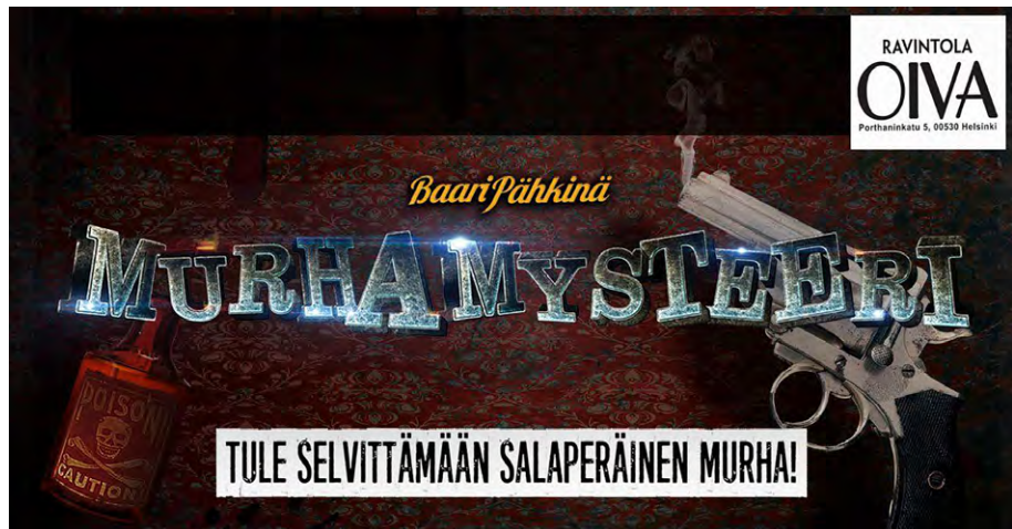
klo 18-21 Baaripähkinä: MURHAMYTEERI

KLO 18-19 PAHAT ÄÄNET @ KATUGALLERIA MUTTERI, Katugalleria Mutteri, KIRSTINKATU 14 Pahat äänet -yhtye esiintyy katugalleria Mutterissa. Vapaa pääsy. Esteetön sisäänpääsy.