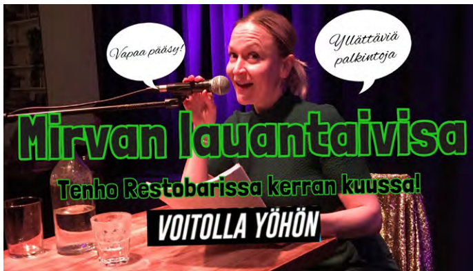
klo 15-17 Mirvan lauantaivisa

Pahat äänet ja toistaiseksi salainen yllätysesiintyjä esiintyvät katugalleria Mutterissa lauantaina 18.5. Vapaa pääsy. Esteetön sisäänpääsy.