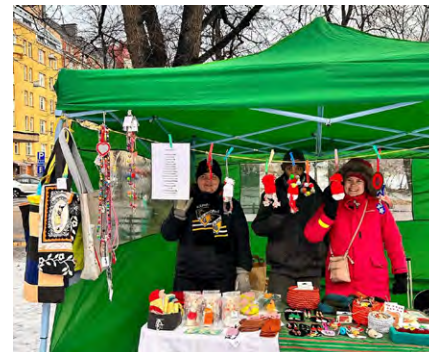
klo 12.15.-14.30 Aula Pop-Up myymälä.