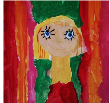
klo 16.30-18.30 Vinksin vonksin - kuvataidepaja perheille.