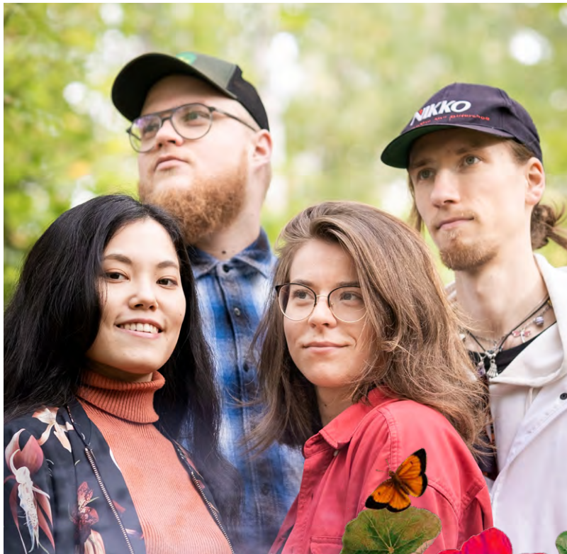
klo 19-21 SunJazz: Kaima