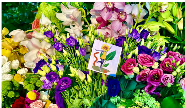
klo 15-15.30 Kohtaamisia kukkaostoksilla.