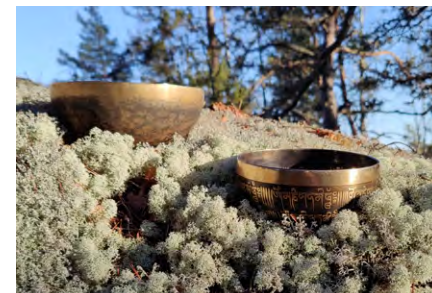
klo 13.30, 14.30 ja 15.20 Pop-up -äänimaljarentoutus (25 min).

Kalliossa asuva burleskitaiteilija Lady Clitter esittää burleskia paikallisen Giggeli yrityksen näyteikkunassa. Jos tahdot, voit tipata esiintyjää paikan päällä! Vapaa pääsy. Esteetön.