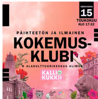
klo 17-22 Kokemusklubi