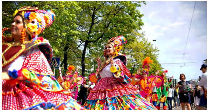
KLO 11-12.15 Sambakulkue starttaa, Sambakoulu Imperio do Papagaio

KLO 11-12.15 SAMBAKULKUE STARTTAA, SAMBAKOULU IMPERIO DO PAPAGAIO, Karhupuisto Jo perinteeksi muodostu-nut Sambakoulu Imperio do Papagaion tanssikulkue starttaa Karhupuistosta tällä kertaa Torkkelinmäelle ja takaisin koristaen Kallion katuja niin väriloistollaan kuin musiikillaan. Yleisö pääsee tanssin pauloi-hin, kun sambaajat saapuvat takaisin puo-