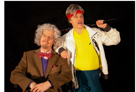
klo 15-15.30 Teatteri Rollo: Harmaat panterit ja puuman metsästys.

KLO 19-21 GET ME, Tenho Restobar, Helsinginkatu 15 Get Me on 10-henkinen disco-funk-yhtye, jonka vaikutteet ovat menneiden vuosikymmenten rytmimusii-kissa: Earth, Wind & Fire, Michael Jackson, Prince jne. Tarttuvat kappaleet, suuri kokoonpano sekä rakkaus rytmimusiikkiin saavat tanssimaan ja rakastumaan! Vapaa pääsy. Tila ei ole esteetön.