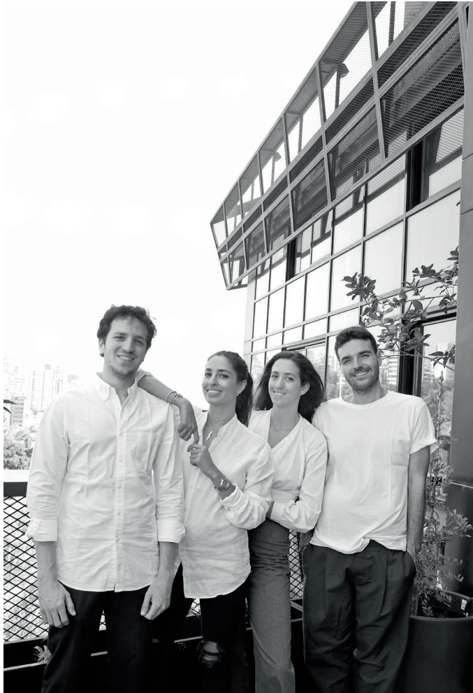
L'équipe de CAL