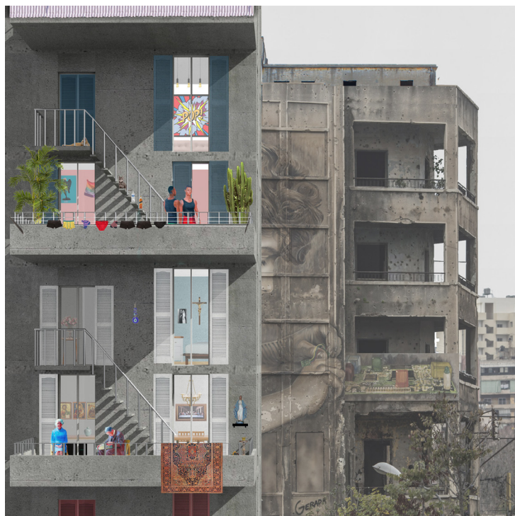
Lebanon, A family affair par Elias Tamer