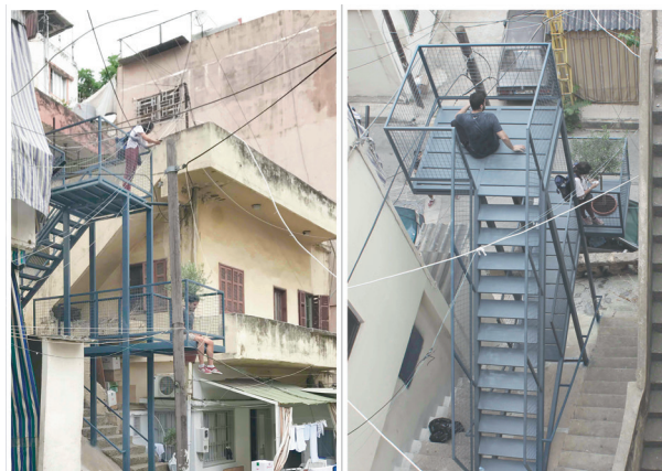
En-Counters par Mohammad Nahleh