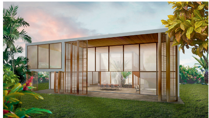
Villa Marcori par Shereen Doummar

York dans la boîte d'architecture REX. Elle travaille actuellement sur plusieurs projets, entre autres, une résidence privée en Côte d'Ivoire, en collaboration avec l'agence espagnole Canales and Gonzales. Elle a travaillé sur le projet House of Fly, qui a fait partie de la Saatchi Gallery. Elle vient aussi de terminer un projet encore confidentiel pour une galerie d'art du centre de Londres, qui ouvrira ses portes en octobre prochain. Elle a fait également partie des agences Jenny Jones Studio, REX à New York et Zaha Hadid à Londres.