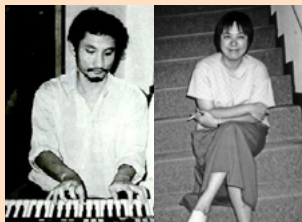
▲ 圖二、三 —— 80年代的徐克與許鞍華

70年代末期，香港電影圈湧現一批新銳導演，包括許鞍華、徐克、嚴浩、譚家明、方育平等，他們的平均年齡不超過三十歲，在電視台實戰兩三年後，不約而同投身電影業。短短數年間，他們以新穎作品在電影圈掀起一股巨浪，為處於低潮的電影業注射了強心劑，開拓了前所未見的新局面。