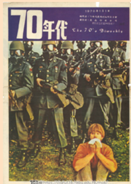
▼ 圖一 —— 《70年代雙週刊》第一期雜誌封面