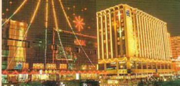
▲ 圖四 —— 80年代尖東的聖誕燈飾