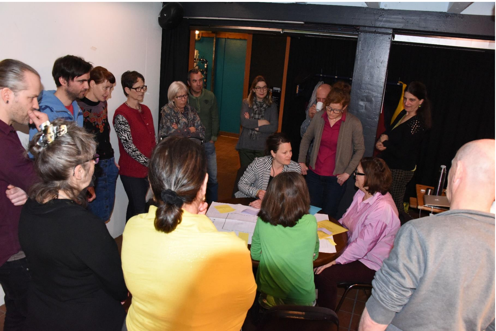
Workshop der Mitglieder der Genossenschaft W'Alter

auf Grundhaltungen. Die Arbeitsgruppen setzen sich mit aktuellen Fragen rund um Wohnformen, Nachhaltigkeit, Entscheidungsprozesse etc. auseinander. Die Bau- und die Finanzkommission der Genossenschaft sind beauftragt das Bauprojekt auszuarbeiten und die Finanzierung sicherzustellen. Der Vorstand als strategisches Organ koordiniert die laufenden Geschäfte, Kommissionen sowie Arbeitsgruppen und setzt Beschlüsse der Generalversammlung um.