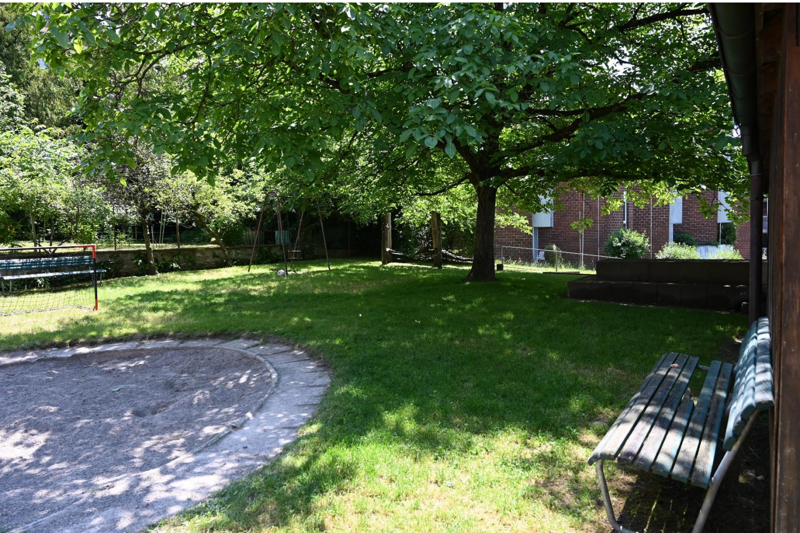
Ansicht bestehender Garten

Die Mitglieder der Genossenschaft W'Alter streben eine Hausgemeinschaft an, die sich aus unterschiedlichen Generationen und Lebensformen zusammensetzt. Als Hausgemeinschaft will die Wohnbaugenossenschaft W'Alter einen lebendigen Ort bilden, der viel Raum für Austausch, Begegnung, Synergien, Interaktion und gegenseitige Unterstützung bietet. An der Zugerbergstrasse 6–10 sollen auch Menschen ein Zuhause zu finden, welche nur über kleine Budgets verfügen oder aus anderen Gründen wenig Chancen auf dem Wohnungsmarkt haben.