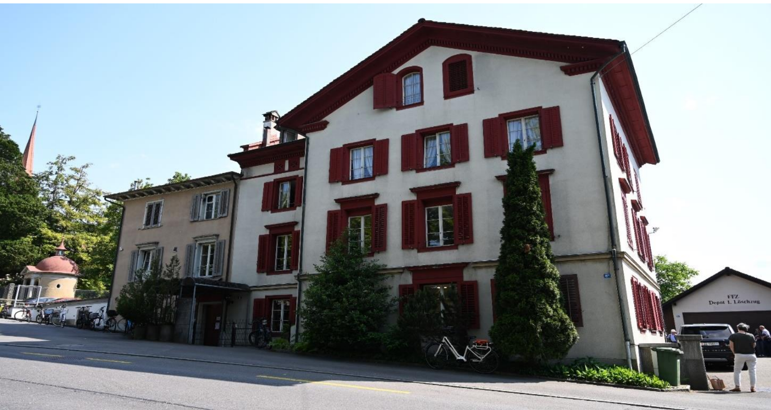
Nordansicht Bestand Zugerbergstrasse 6–10

Die Wohnbaugenossenschaft W'Alter will durch verschiedene Massnahmen mithelfen, die Ziele der 2000-Watt-Gesellschaft zu erreichen